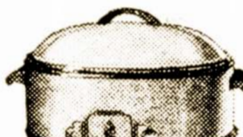
Everhot Electric Roaster $18.95

Pamatykite juos pas ELECTRIC SHOPS. Išdirbystės ir modelių pasirinkimsa jusų žė mais ir patogiais laikais.