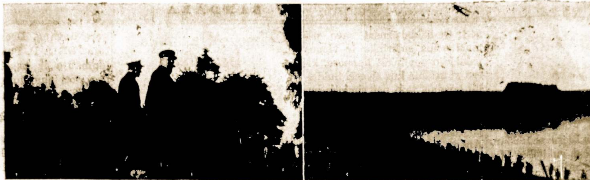
TAIP ATRŪDO LIETUVIŲ KARIUOMENĖ MANEVROUSE. JOS RUPESNIU YRA SAUGOTI VALSTYBĖ NUO PRIEŠO.