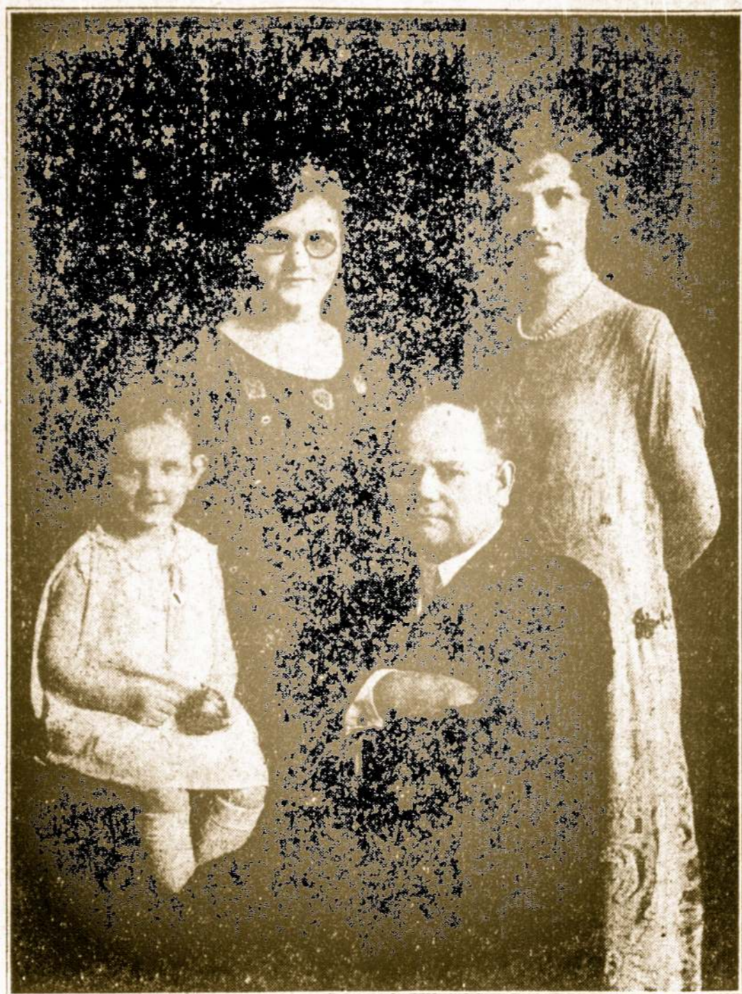
Sandaros Prezidentas ir šeima

LINKIME VISIEMS SANDARIECIAMS, "SANDAROS" SKAITYTOJAMS IR VISIEMS GEROS VALIOS LIETUVIAMS LINKSMŲ KALĖDŲ IR LAIMINGŲ NAUJŲ METŲ.