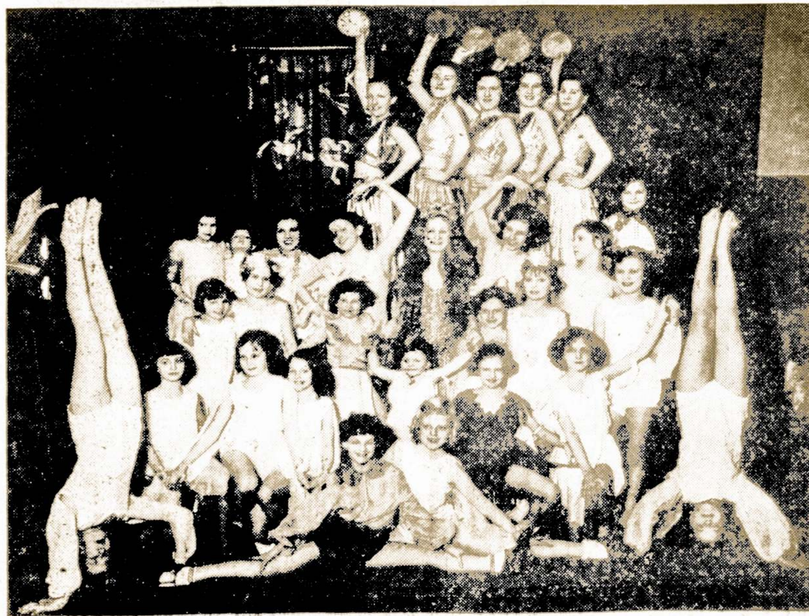
JAUNOSIOS BIRUTES BALETAS