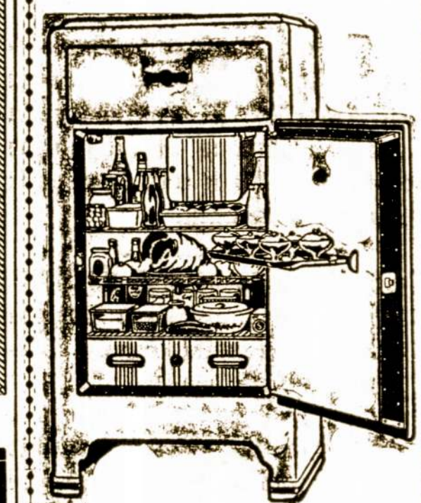
Pasirinkimas 1937 metų Mados

Siuloma aukščiausios rūšies Refrigeratoriai už specialiai mažas kainas ant Lengvų išmokėjimų — kurie pareina apie 15 centų i dieną