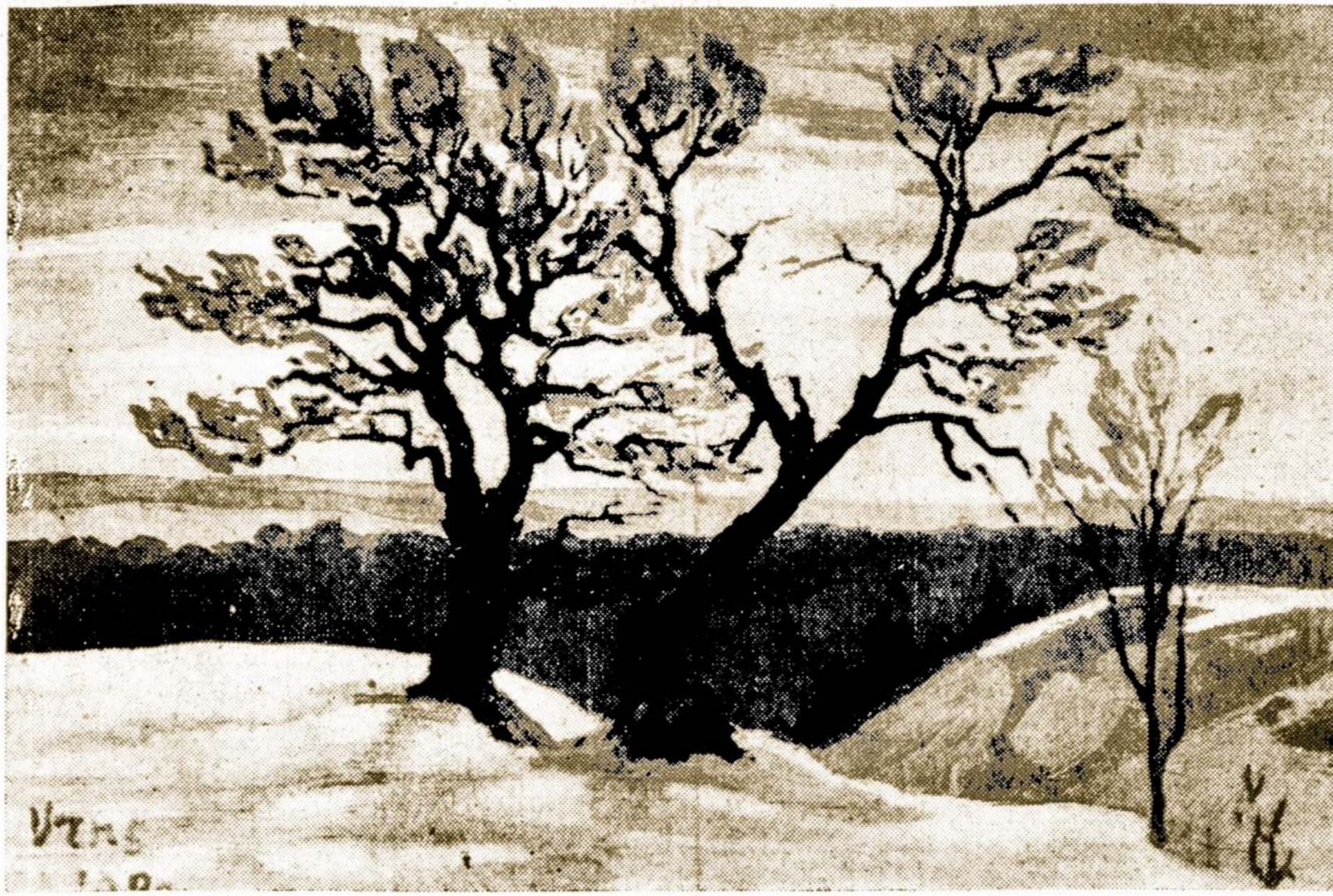
Šį paveikslą piešė žymus dailininkas A. Varnas, kuris neseniai minėjo 30 metų savo kurybinio darbo sukaktuves.