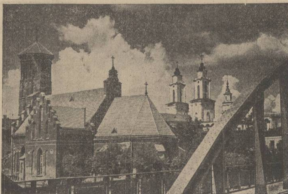
VIENAS LAIKINOSIOS LIETUVOS SOSTINĖS GRAŽIŲJŲ KAUNO VAIZDŲ.