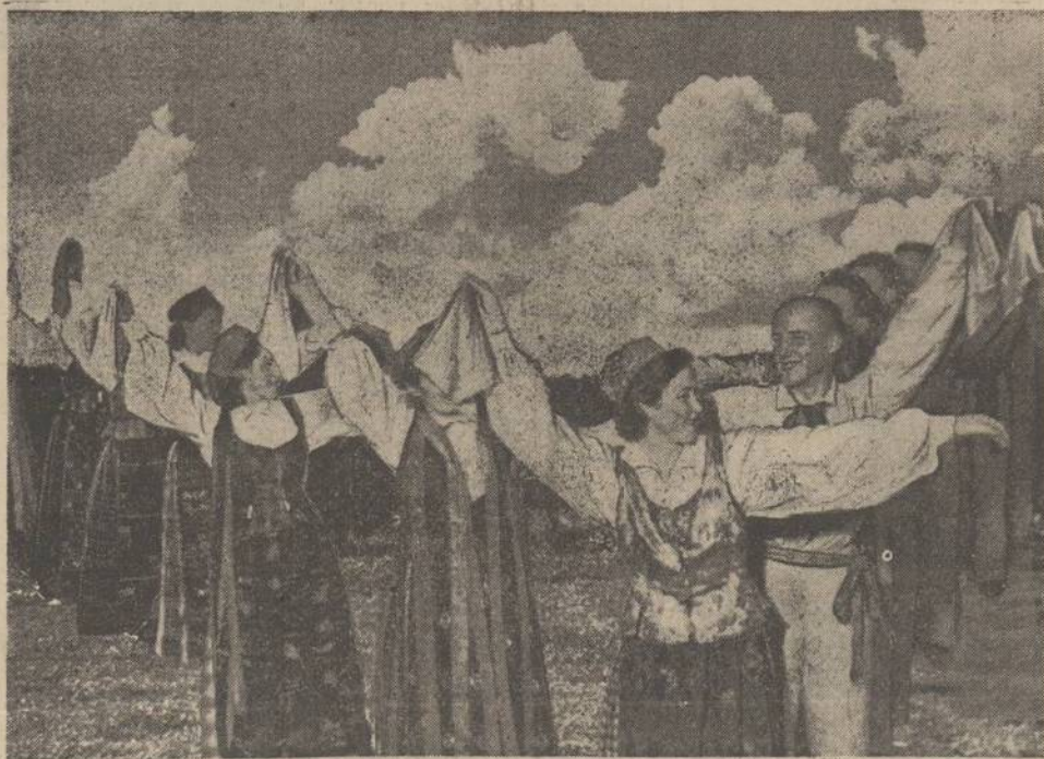
Lietuvoje gaivinami senovės tautiškieji šokiai. Jie jaunuomenės yra labai mėgiami. Šiame atvaizde matome jaunuomenę tautiškais drabužiais šokančių senovės žemaičių tautišką šokį Blezdinėlę.

do, kad Amerikos žmonės nėra jau taip dideli entuziastai linkui diktatorių ir diktaturų.