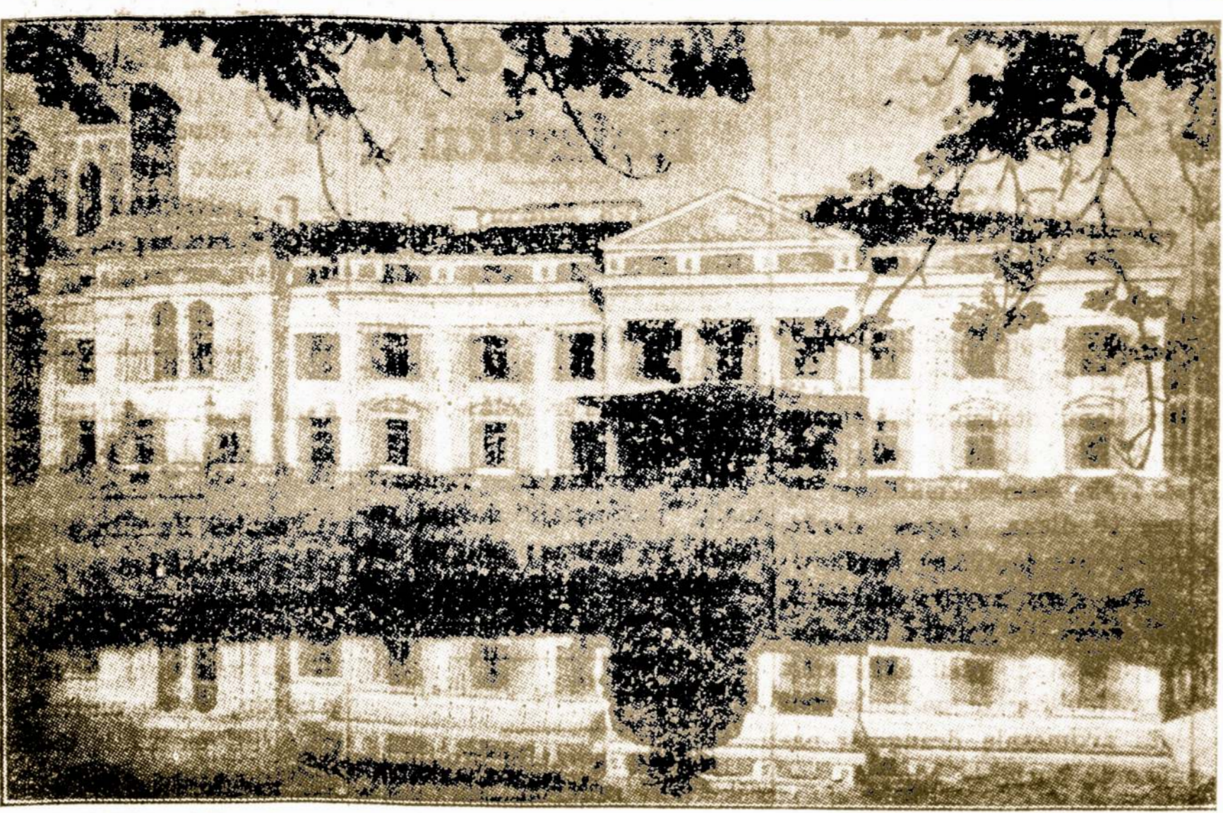
Senieji Rumai Verkiuose, Netoli Vilniaus. Apie Šią Vietą Užsiliko Daug Senovės Davinių.

Ten Jaunimas yr' žvalgus Ir budėjantis, sargus; O kentėjimas tylus Slepia skausmą ir vaidus. Linksmą dainą ji dainuoja. Ji Tėvynėj, Ji gimtinėj Sirdžiai suraminimą suranda.