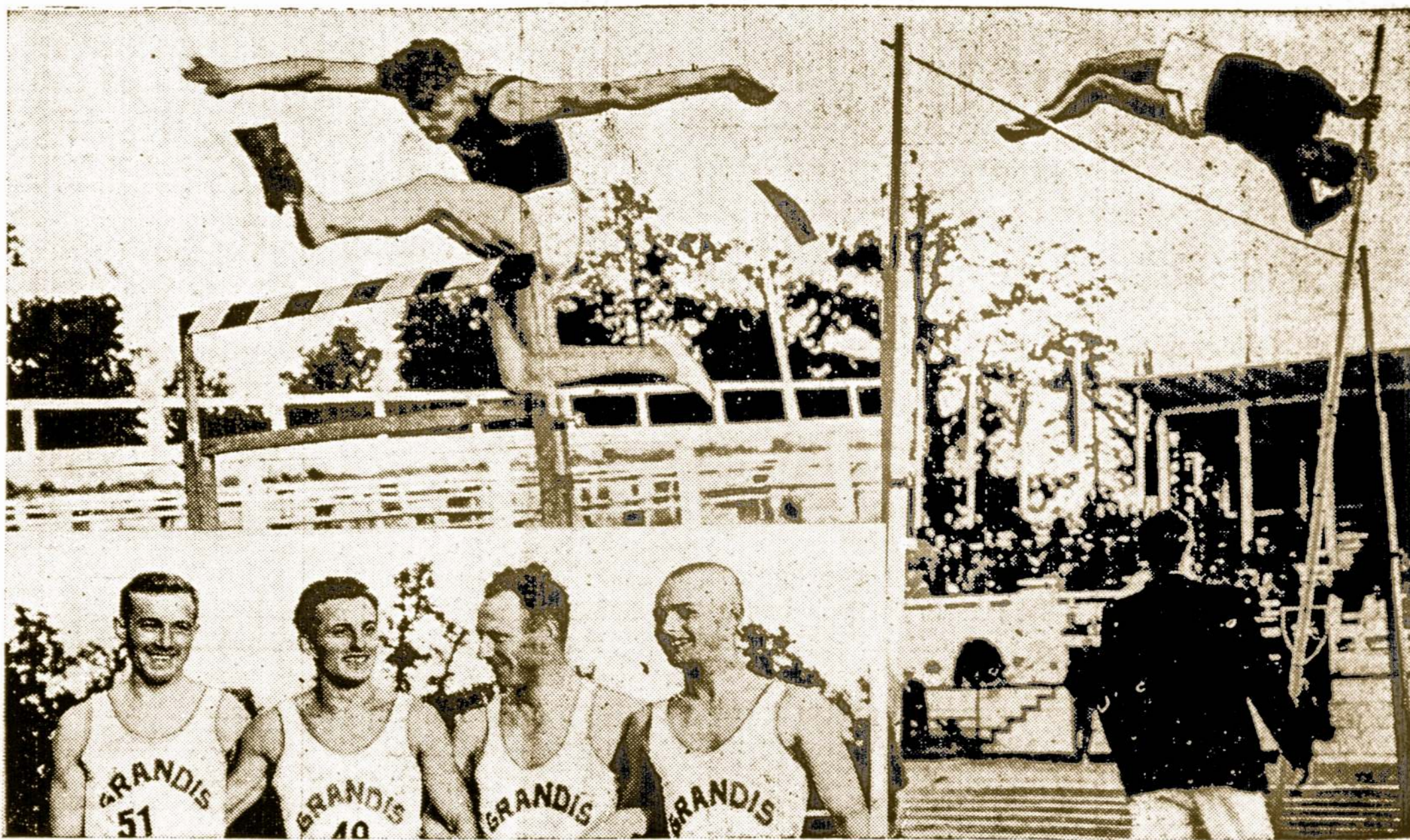
Pirmosios Lietuvos Olimpiados Dalyviai Parodo Visokių Sportiškų "Triksų."

1985 metais: — Šį vakar noriu pasiekti Lietuvą, o rytoj sugrišiu atgal.