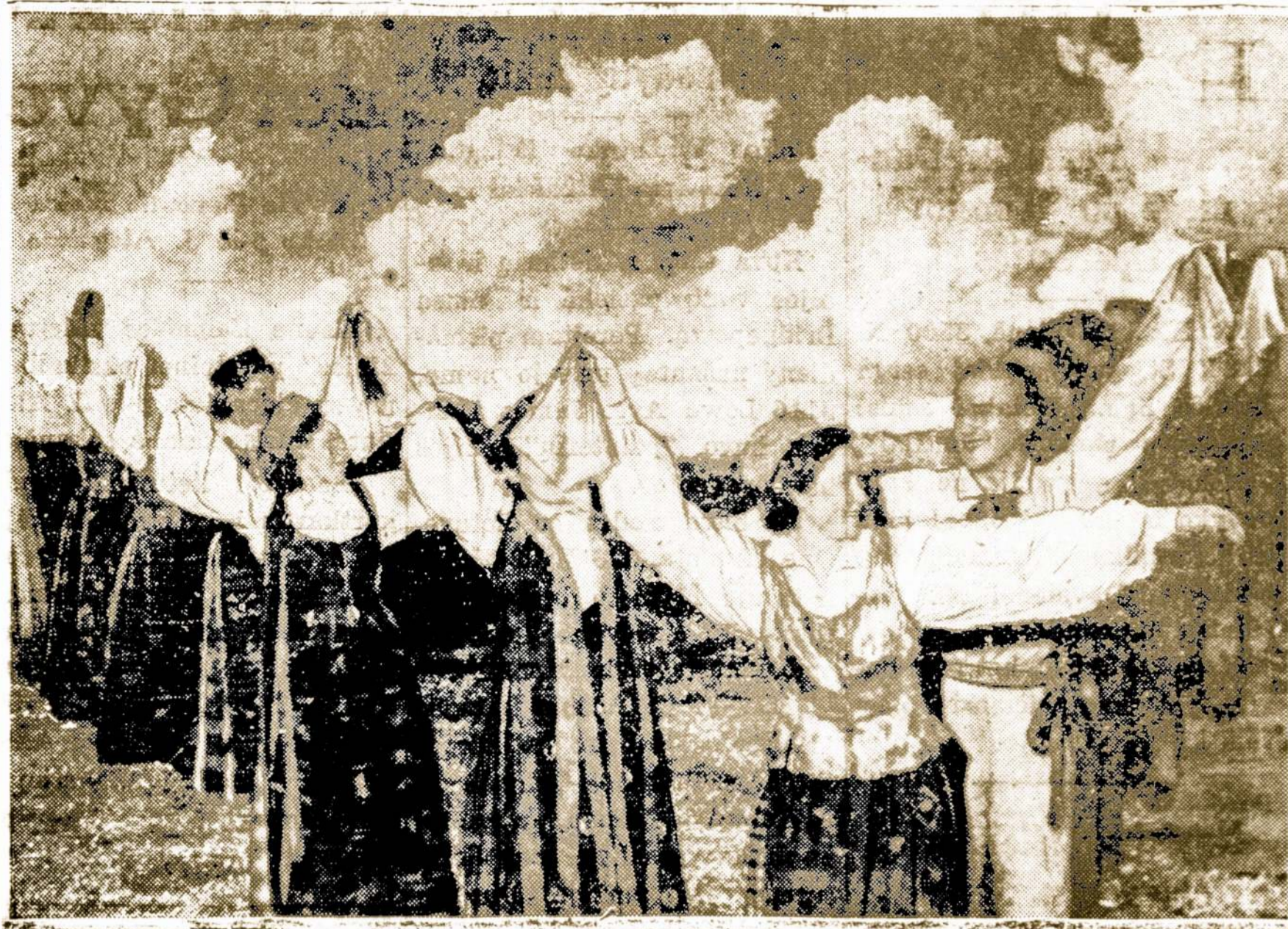
Grupė lietuvių šokėjų Lietuvos Tautinėj Olimpiadoj.