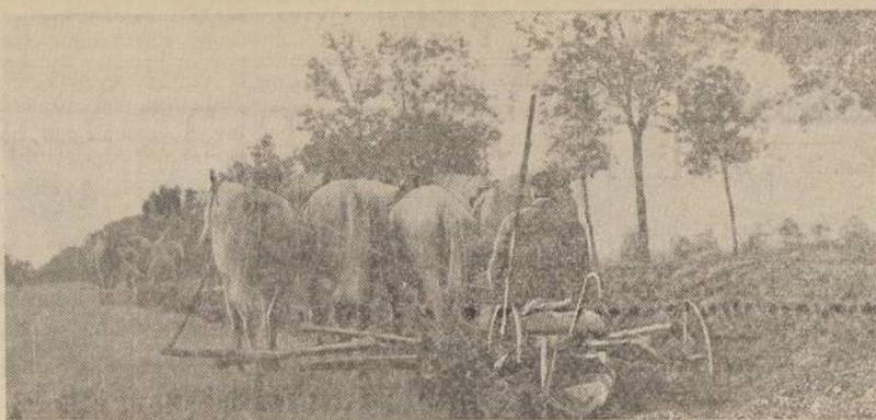
Country Road in Lithuania During Busy Summer Time.