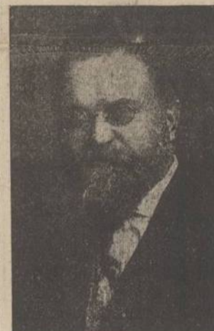
Dr. Jonas Šliupas

Tautinio atgimimo veteranas ir aušrininkas Dr. Jonas Šliupas mūsų nepriklausomybės pradžioje atstovaudamas Lietuvai Londone pašventė daug laiko peržiūredamas Britų muziejaus istorinių žemėlapių kolekcijas ir atrankindamas ten esančius Lietuvos žemėlapius. Jis ten surado daugiau kaip 30 istorinių Lietuvos žemėlapių iš 17-to ir 18-to amžių ir savo lėšomis pasamdė oficialinį to muziejaus fotografą, kad tuos žemėlapius nu fotografuotų. Visa tai gerbiadam Dr. Šliupui kainavo daug darbo ir pinigų. Padaryta net 39 stambus (50 iš 40 centimetrų didumo) negatyvai, kuriuos visus dabar Dr. Šliupas dovanojo Lietuvos geografinėi draugijai.