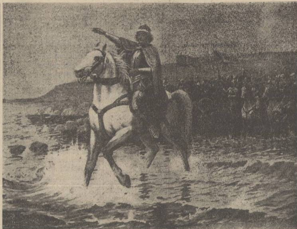
Vytautas, Lietuvos Valdovas, Pasiekęs Juodasias Juras

Toks pareiškimas, mums atrodo, pervėlai padarytas. Budami paš komunistus „ant burdo“ kaipurie socialistų lyderiai taip apsiprato, kad išsibrausti vargiai ar benores.