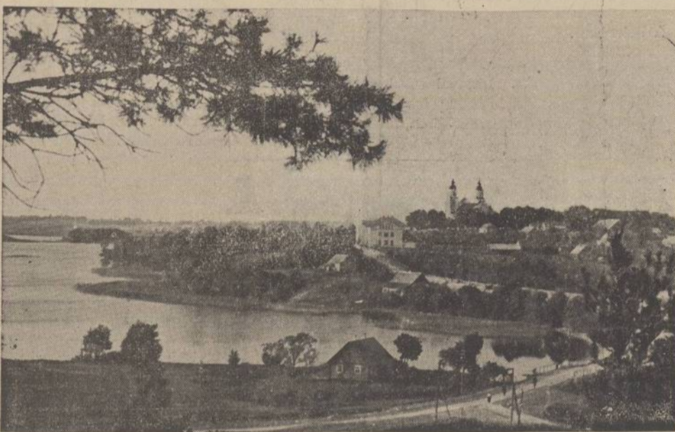
Gražusis Zarasų Kraštas, Šiaurinėj Lietuvoj, Kur Apsilanko Nemažai ir Amerikos Lietuvių.

Kolumbas, Amerikos atradėjas, mirė dideliausiam skurdė. Dabar, matyt, žmonių širdys suminkštėjo ir jie pagerbia ne tik jo atmintį, bet ir liekanas.