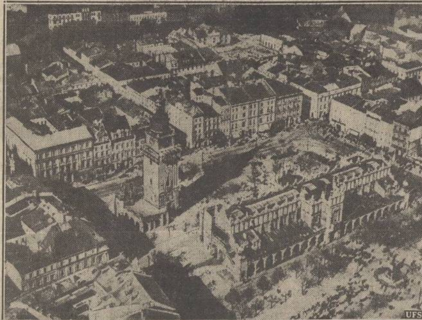
Bendras Vaizdas Lvovo Miesto Apie Kurį Eina Smarkus Mušiai Tarp Vokiečių ir Lenkų. Sakoma, Jog Lvove Užmušta 30,000 civilių žmonių.

Ketvirtadieny, rugsėjo 21 dieną susirenka Suv. Valstijų kongresas apsvarstyti pakeitimą neutralumo įstatymo ta prasme, kad kariaujančiom šalim būtų leista pirkti ginklų. Tuo pakeitimu, beabejo pasinaudotų anglai ir prancuzai.