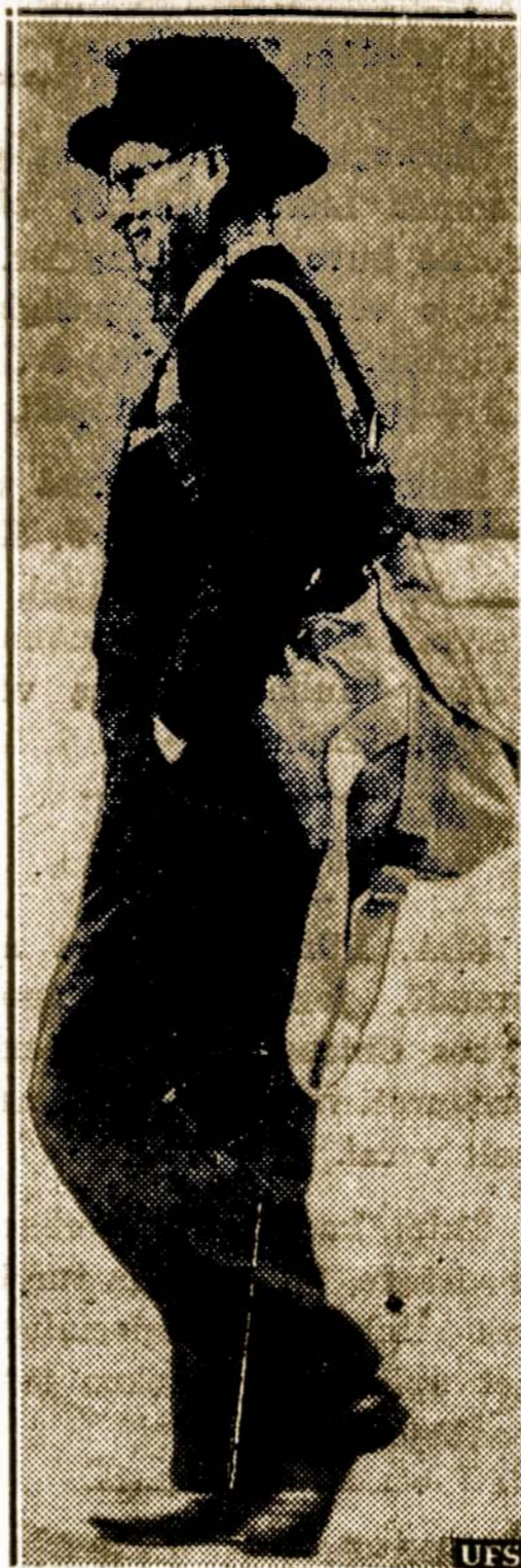
Suv. Valstijų Ambasadorius Londone Kenneedy visad nešasi su savim Gazo Maską.