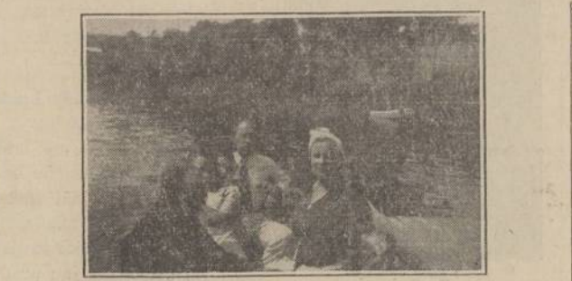
Plaukiojant ramuoju Lietuvos ežeru yra ne tik smagumas, bet ir geras poilsis.

Mano kelių metų svajonė išsipildė šią vasarą: aš aplankiau savo gimtinį kraštą — Lietuvą. Ir nors teko padaryti ilga kelionė ten ir atgal, bet igyti išpuščiai ir malonumai pasiliks mano atminty visados.