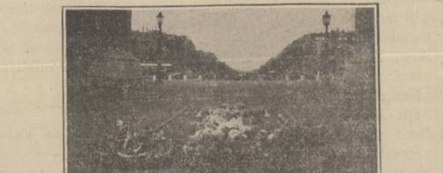
Moderniškojo Kauno Vaizdas

Išlipus iš laivo važiavome automobiliu į Paryžių, kuriam išbuvom apie 4 dienas ir turėjom progos susitikti su vietiniais lietuviais, kurie aprodė mums žymiausias ir gražiausias vietas. Mano žmona ir dukterė buvo sužavėtos Paryžiaus vaizdais.