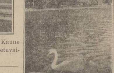
Karališkoji Gulbis Kauno Botanikos Sodo Vandenyne.

Karališkoji Gulbis Kauno Botanikos Sodo Vandenyne. Atvykę į gmtinį kaimą jautriai ir širdingai pasisveikinom su saviškiais: motina, broliu ir giminėmis. Jie irgi džiaugėsi susilaukę tolimų svečių. Senutė motina net apsi- verkė. Jų gyvenimas ir buvis man atrodė geresnis negu tais laikais, kai palikau juos. Ap- sidairius aplink, aš įsitikinau, jog tie, kurie tikrina, jog Lietuva nieko gero neduoda savo žmonėms, klysta ir skelbia neteisybę.