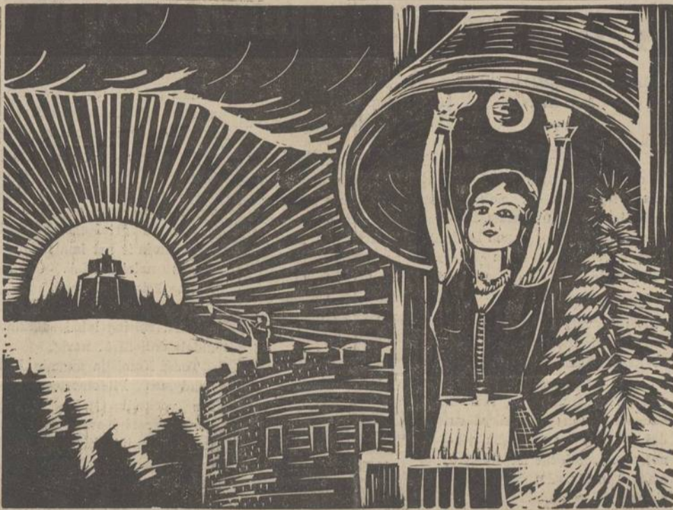
Laisvės Varpas iš Kurio Muziejaus Bokšte Kaune Paskelbė, Jų Vilnius, Pagaliau, Tado Išvaduos.

Neužmirškite, jog lapkričio 1 dieną prasideda didžiulis Sandaros vėjus, į kurį kviečiame įstoti visus mūsų draugus ir veikėjus. Jeigu jums patinka skaityti šis laikraštis ir gauti naudingų ir įdomių informacijų, tai patarkite ir kitiems užsiprenumeruoti. Tegul kiekvienas susipratus lietuvis būna Sandaros skaitytoju. Tas išeis į naudą jam ir visam lietuvių judėjimui.