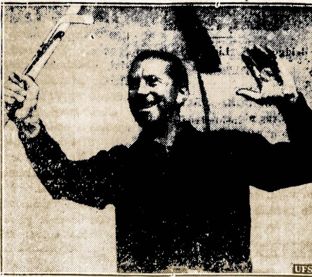
basebolininkas, bet ir pasižymėjęs golfe.