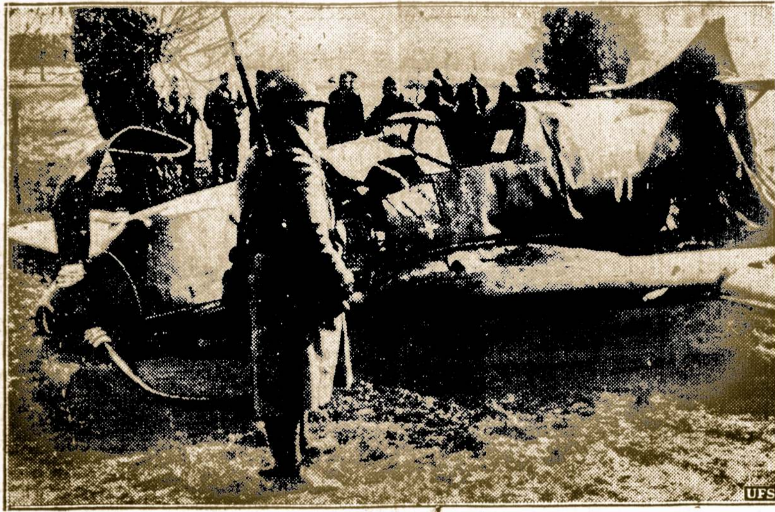
Užbaigė Savo Dienas. Taip atrodo nazių garsusis Messerschmidt karinis orlaivis, kurį numušė prancuzų kanuolės. Šalė sudaužyto orlaivio stovi prancuzų sargyba.

dieny, sausio 28 dieną įvyksta metinis Sandaros bankietas Chicagoj. Visi tautiečiai kviečiami atsilankyti ir smagiai praleisti vakarą. Bus graži programa, skanių valgių ir šokiai. Bankietas įvyks South Side Viking Temple, 69th gatvė ir Emerald Ave. Pradžia 5:30 val. vakare.