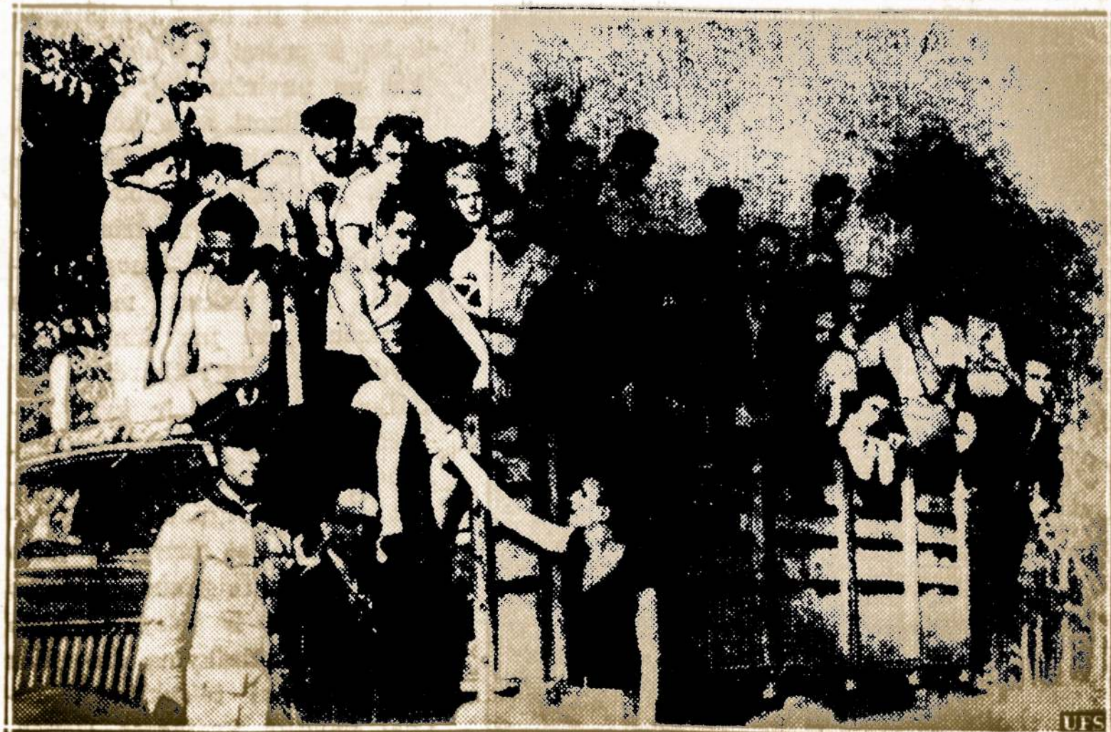
NAZIŲ TREMTINIAI CENTRALINĖJ AMERIKOJE. — Paveiksle matome grupę vokiečių jurininkų Dominican valstybėj. Nenorėdami patekti, anglų rankas jie paskandino savo laivą Hanoover ir atsidadė Centralinėj Amerikoje.

Danai per Velykas pratę siuntinėti, kaip mes 1 balan