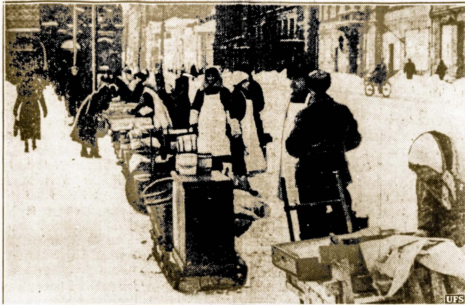
Suomių gyventojai skubiai apleidžia tas vietas, kurios atiteko Sovietų Rusijai. Tokių pabėgėlių dabar yra apie pusė milijono ir jais rupinasi Suomių Valdžia.

Aišku, jog paskelbdami tokius "faktus" naziai tikisi pakirsti koją trečiam prez. Roosevelto terminui. Vienok jie čia negerai apskaitliavo. Amerikos žmonės kreivai žiūri į tokius nazijų maneversus ir netiki Berlyno propagandai. Dauguma yra įsitikinę, jog tie "dokumentai" yra falsifikuoti nuo pradžios iki galo.