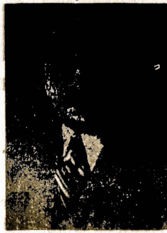
Lietuvos Konsulas Chicagoje P-nas P. DAUŽVARDIS