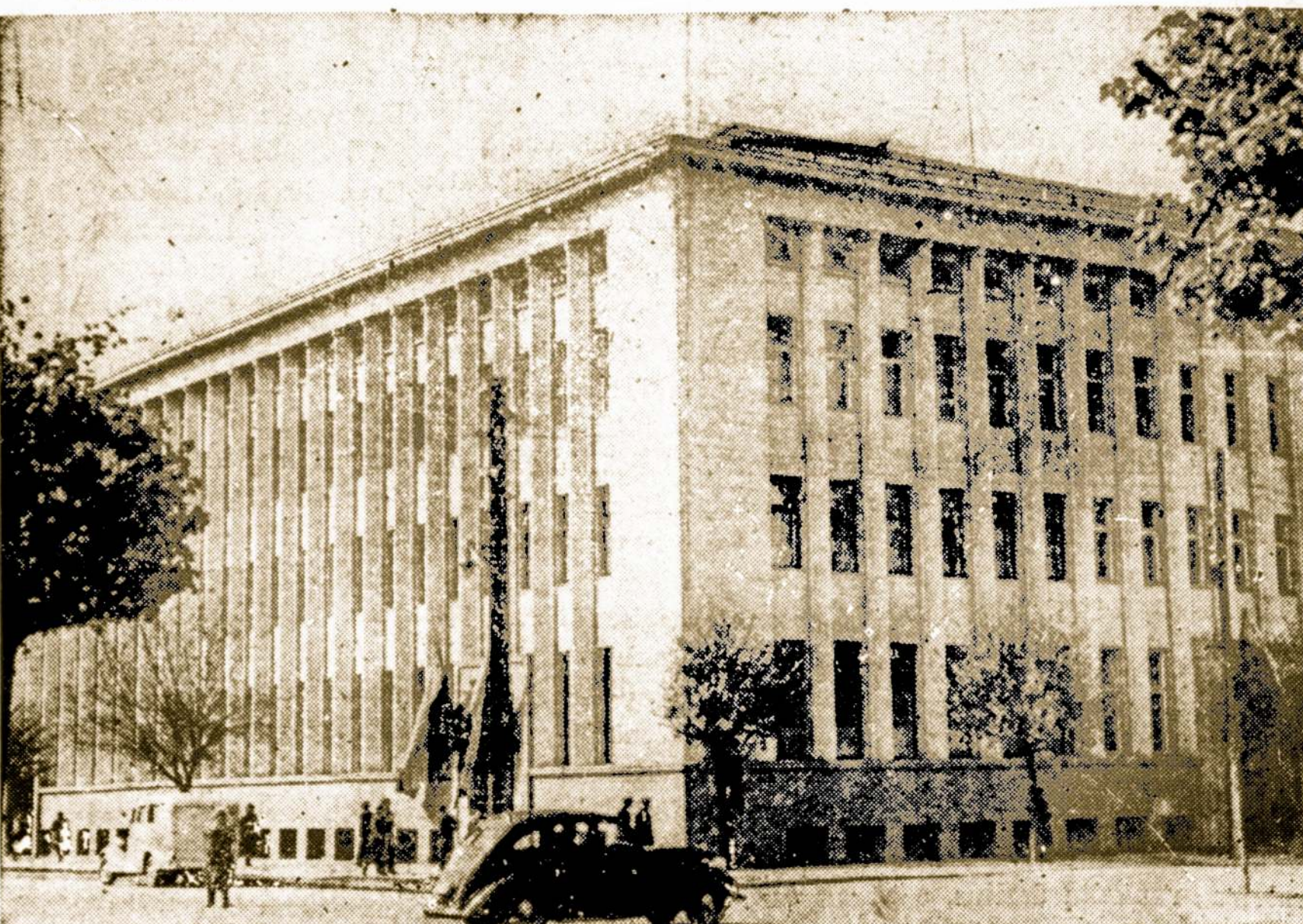
Lietuvos Darbo Rumai Kaune, kurie Dabartinės Vyriausybės Aktu Tapo Paversti Profesinių Sąjungų Centru.

Rezliucijas, kurias jie išnešė palaidojimui Lietuvos nepriklausomybės, irgi paskelbė ne savo tikru, bet kokiu tai "darbininkų" vardu.