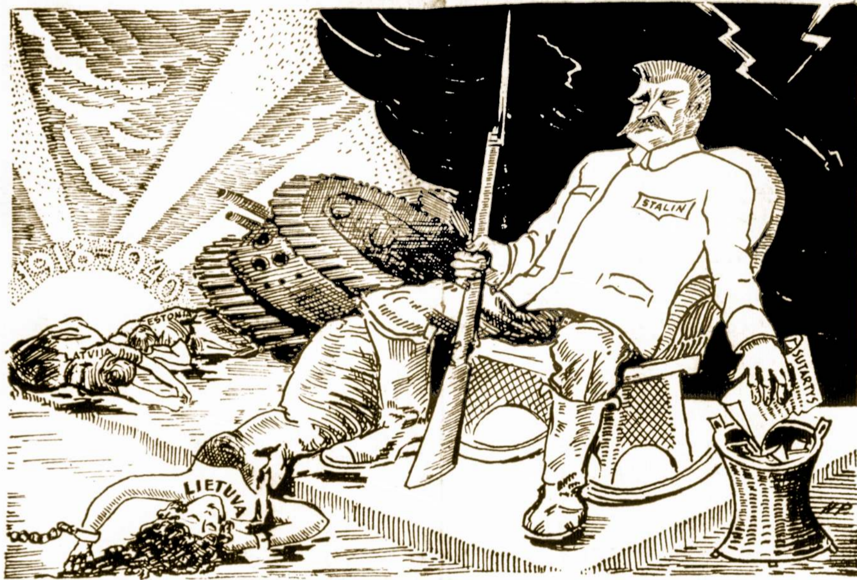
Tokią Tai Apsaugą Ir Laisvę Suteikė Lietu vai Stalinas

ir taip nepersekiuoja žmonių, kaip šių dienų bolševikai. Caras Nikolajus ir sapnuot nemano apie tokius žiaurumus, kuriuos dabar pritaiko lietuviams Stalino gėgė.