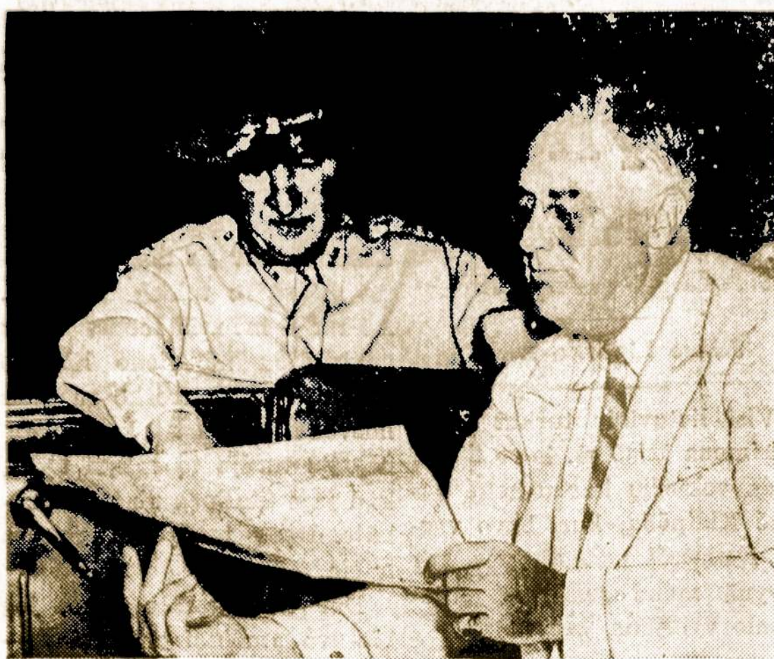
The situation in the nation's biggest peace-time army maneuvers is explained to President Franklin D. Roosevelt by General Hugh Drum at Norwood, New York. The President, who is seated in his car, and the general carefully go over a map of the terrain over which the maneuvers were held.