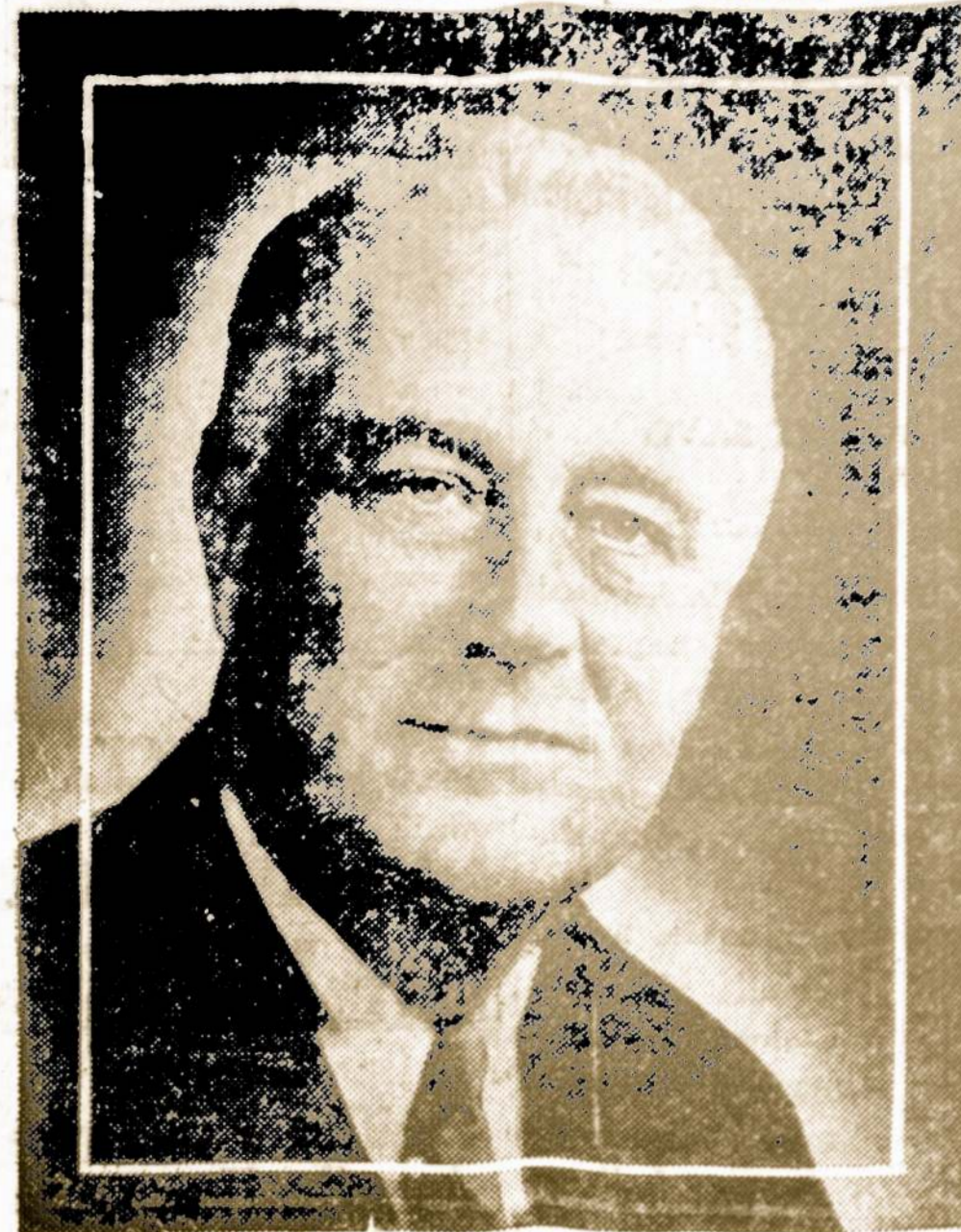
PREZIDENTAS F. D. ROOSEVELTAS

Šioms reformoms republikonų partija buvo griežtai priešinga. Ir jei tik toji partija su savo kandidatu Willkie paimtų valdžią į savo rankas visos tos reformos ir pagerinimai paprastų žmonių buvio taptų panaikinti ir Wall Streetas vėl seimininkautų visoj šaly.