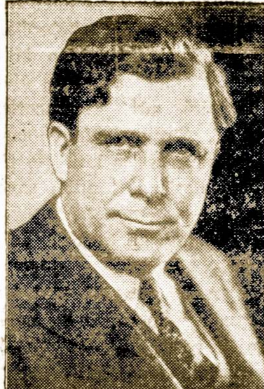
For President ☒ W. L. WILLKIE