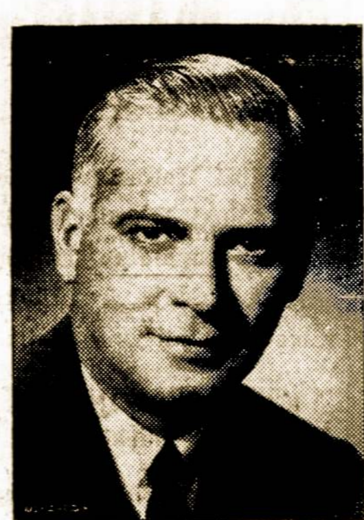
For Govtrnor ☒ DWIGHT GREEN

UŽTIKRINKITE LIETUVIŲ ATSTOVYBĘ VALDŽIOJ Balsuodami Už Lietuviams Prielankią Republikonų Partiją