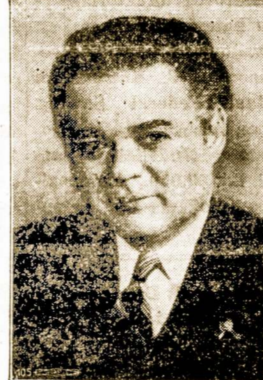
For U. S. Senator ☒ C. W. BROOKS