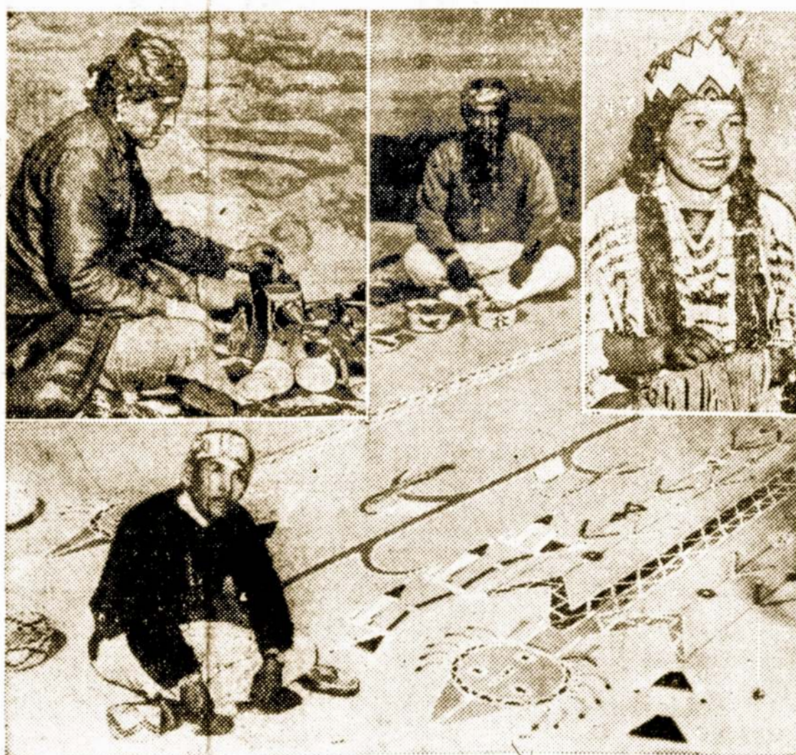
The almost forgotten arts developed by Indians will be recalled January 1 when the government, universities and museums will co-operate to feature their achievements. Above, a group of Navajo Indians demonstrate their handiwork, which will appear in the museum of modern art, New York city. Upper right: A young Indian girl proudly wears traditional tribal costume.