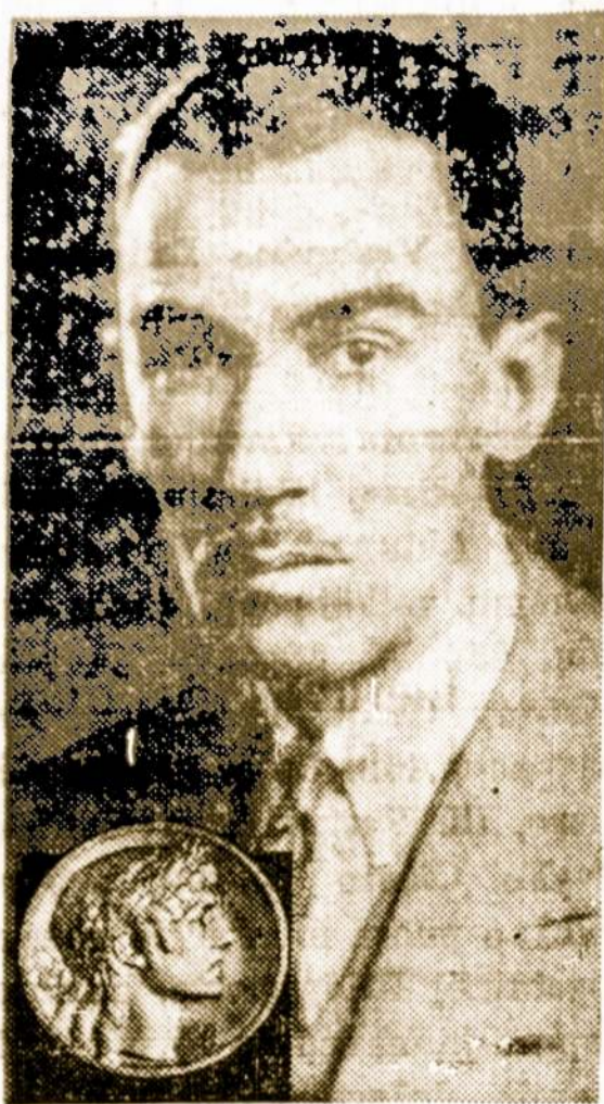
R. E. Sherwood, 44, creator of "Abe Lincoln in Illinois," will be awarded the gold medal of the National Institute of Arts and Letters for achievements in the field of drama. Presentation will be made in New York.