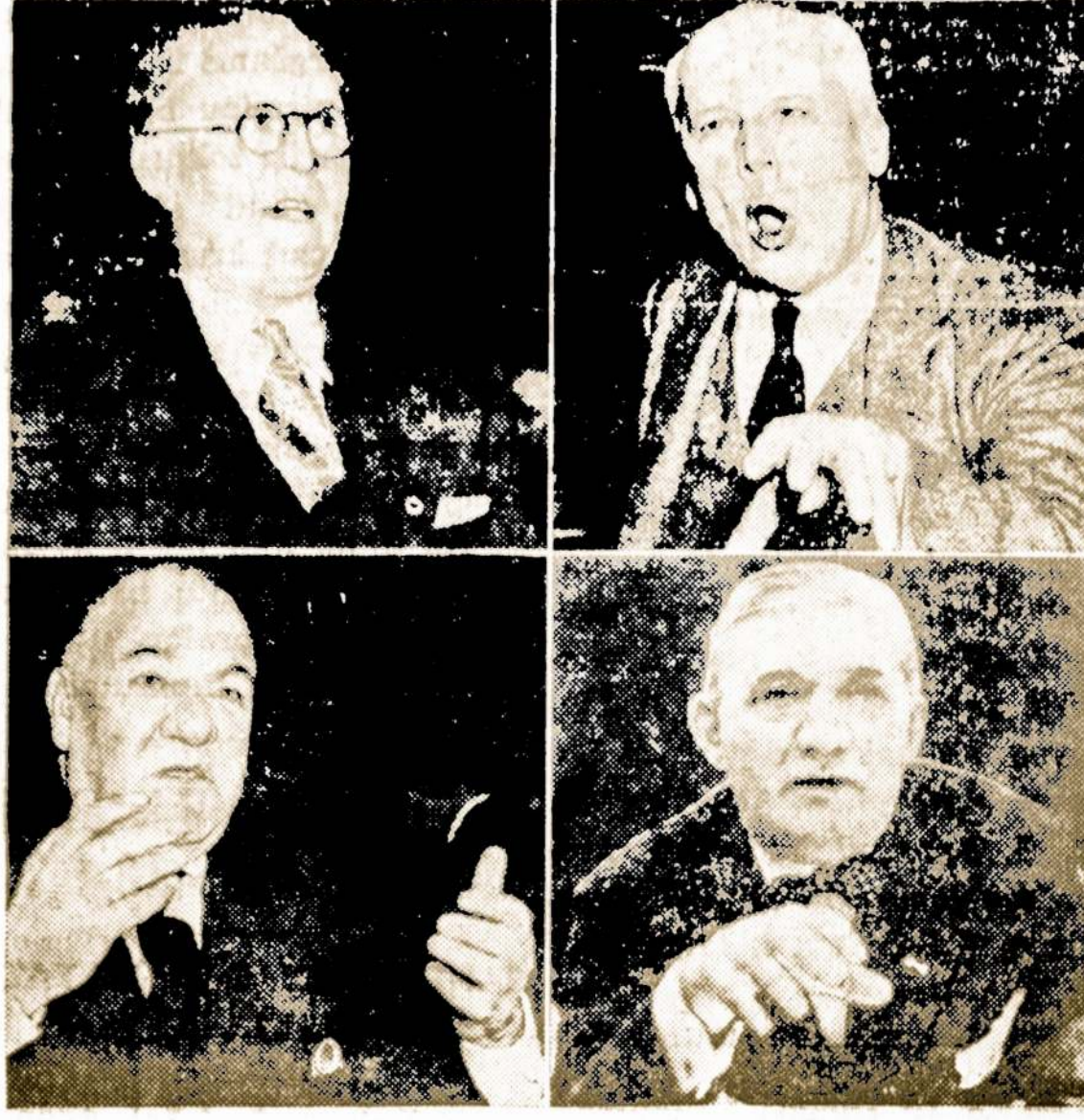
Earnestness, sincerity and patriotism are revealed in these candid camera "shots" of four national figures as they testified on the "Lend-Lease" bill. They are: upper left, J. P. Kennedy, retiring ambassador to Britain. Lower left: Hugh Johnson, columnist. Upper right, Norman Thomas, socialist leader, and William Knudsen, defense production chief.