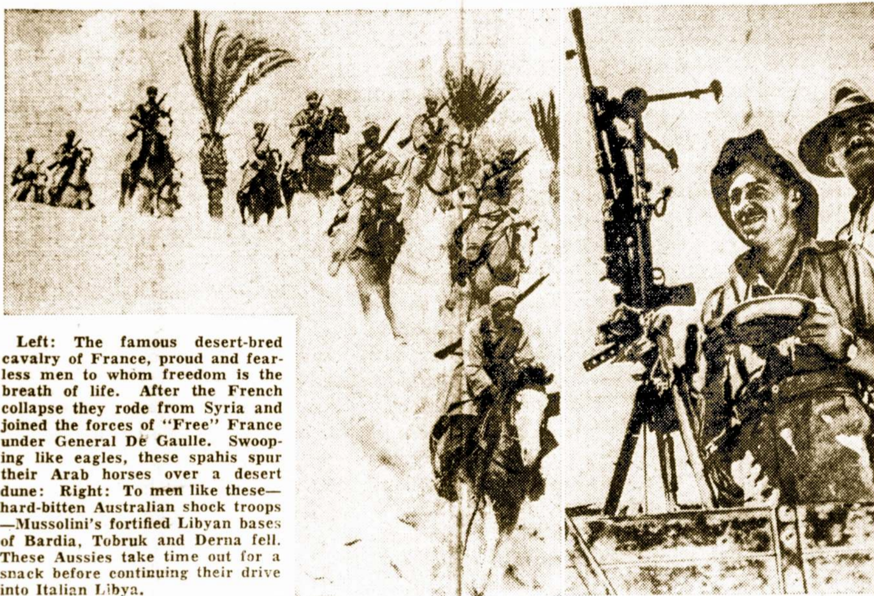
Left: The famous desert-bred cavalry of France, proud and fearless men to whom freedom is the breath of life. After the French collapse they rode from Syria and joined the forces of "Free" France under General De Gaulle. Swooping like eagles, these spahis spur their Arab horses over a desert dune: To men like these—hard-bitten Australian shock troops—Mussolini's fortified Libyan bases of Bardia, Tobruk and Derna fell. These Aussies take time out for a snack before continuing their drive into Italian Libya.