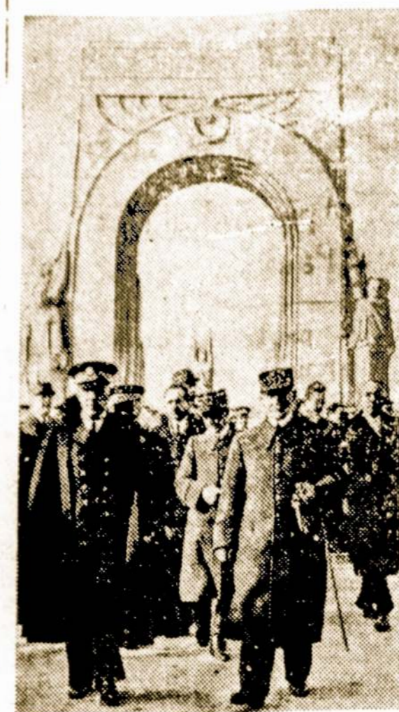
Marshal Henri Petain (right) with Admiral Jean Darlan, French navy chief, leaving memorial services to France's colonial pottus, in Marseilles. The gesture was seen as a Vichy bid to prevent any more colonies from joining the "Free French."