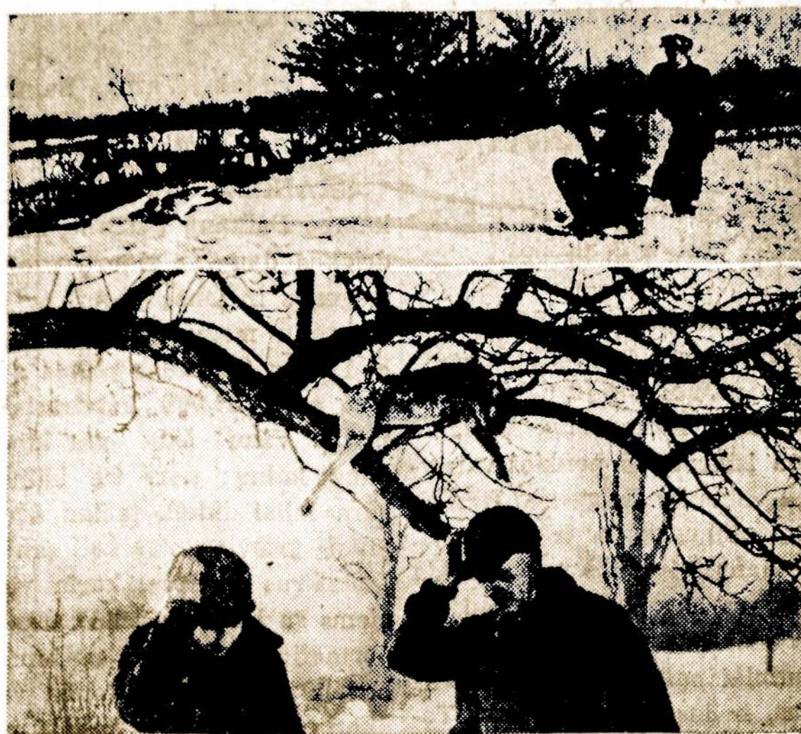
With big drives by a hundred hunters or more on Ontario's giant hares, which weigh up to 18 pounds, legislation is sought to limit driving parties to 15 persons. In top picture a hunter aims at an unfortunate rodent, while below a couple of hunters seek the elusive hare whose speed matches the best of man and dog.