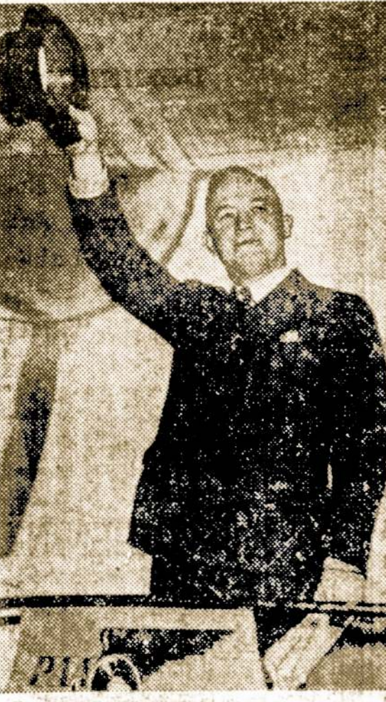
Maj. Gen. H. H. Arnold, chief of the U. S. army air corps, shown as he boarded a clipper plane in New York for flight to Europe. General Arnold will go to London to act as an official observer for the war department.

kievčia lietuvių visuomenę visuomet, o ypač virš minėtose dienos apsilankyti jų puikioje užėigoje. Jusų palinksminimui bus gera muzika ir teikiami užkandžiai veltui. Norintieji smagiai praleisti laiką, apsilankykite Grand Opening dienomis — R.