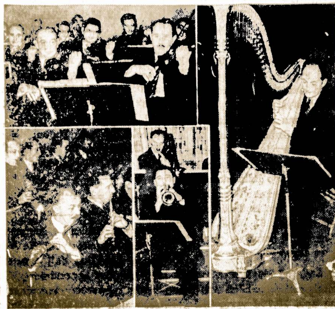
Cultural relations between Western hemisphere nations will be strengthened May 2-3 as 19 Latin-American nations and Canada join the U. S. in observing National Music Week. The observance will be opened May 3 by the NBC Summer Symphony orchestra (above), which will present a special concert on a coast-to-coast network.