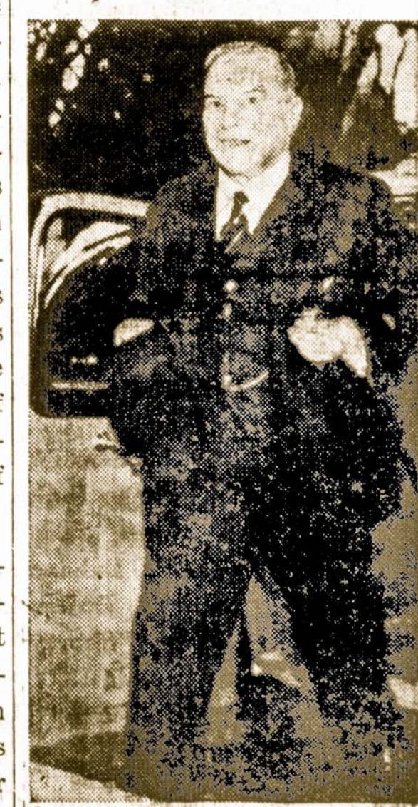
Premier W. L. Mackenzie King, of Canada, stepping out of his car to confer with the President at the White House. Aid for Canada on a lend-lease basis was said to have been the chief topic of discussion at the meeting.

Prez. Rooseveltas pareikalavo, kad būtų pradėta gaminti po 500 bombonešiuų mėnesį. Toks orlaivis-18 tonų ir gali skristi 7,750 mylių be nusileidimo.