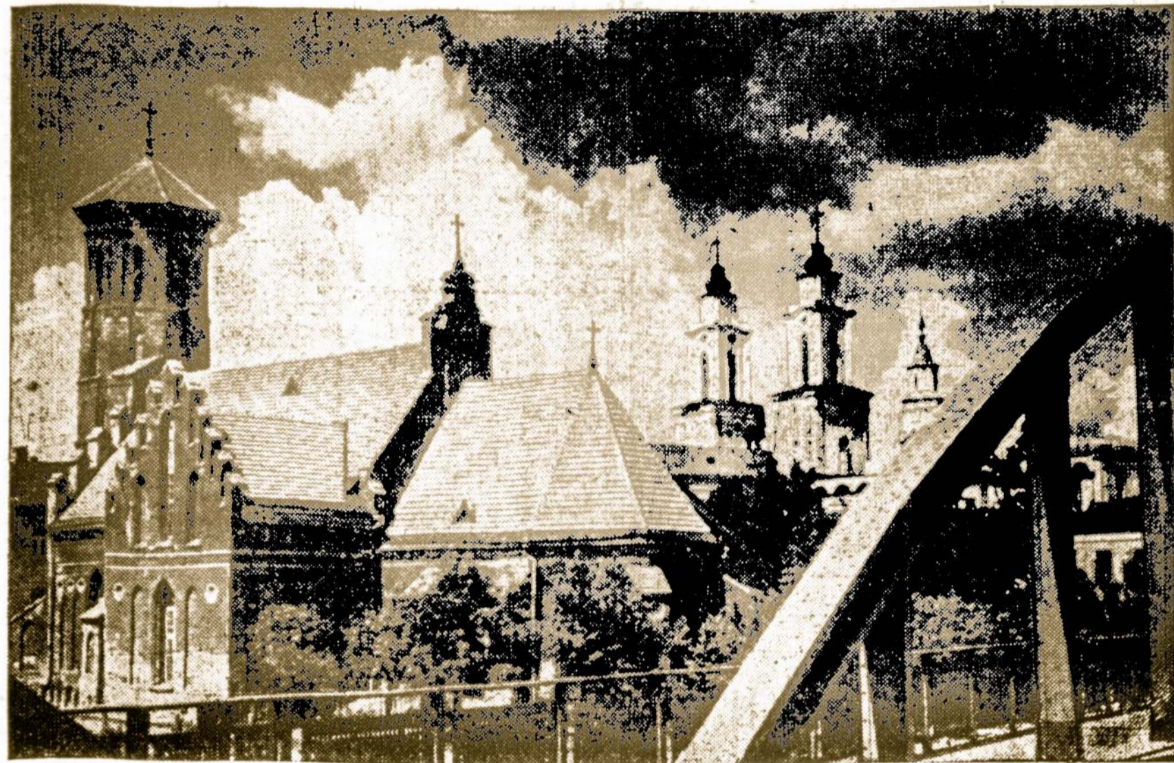
Kauno miesto vaizdas. Laikinoji Lietuvos Sostinė buvo apdaužyta nazių orlaivių ir bol- ševikų kanoulių, kuomet ten įvyko Lietuvos sukilimas.

Amerikos lietuviai ir jų or- ganizacijos turės pasiimti į sa- vo rankas Lietuvos reikalų gy- nimą. Per Washingtoną mes galėsime daug ką atlikti ir lai- mėti. Prez. Rooseveltas nepa- keitė savo nuomonės link Lie- tuvos. Mes gi privalom įrodyti savo darbu ir pasišventimu, jog gelbstim Lietuvai; gelbs- tim trims milijonams žmonių pasiluosuoti iš svetimos oku- pacijos. Kai kiti pamatys mu- sų nuoširdžias pastangas, tuo- met ir jiems bus smagiau su- teikti pagelbą.