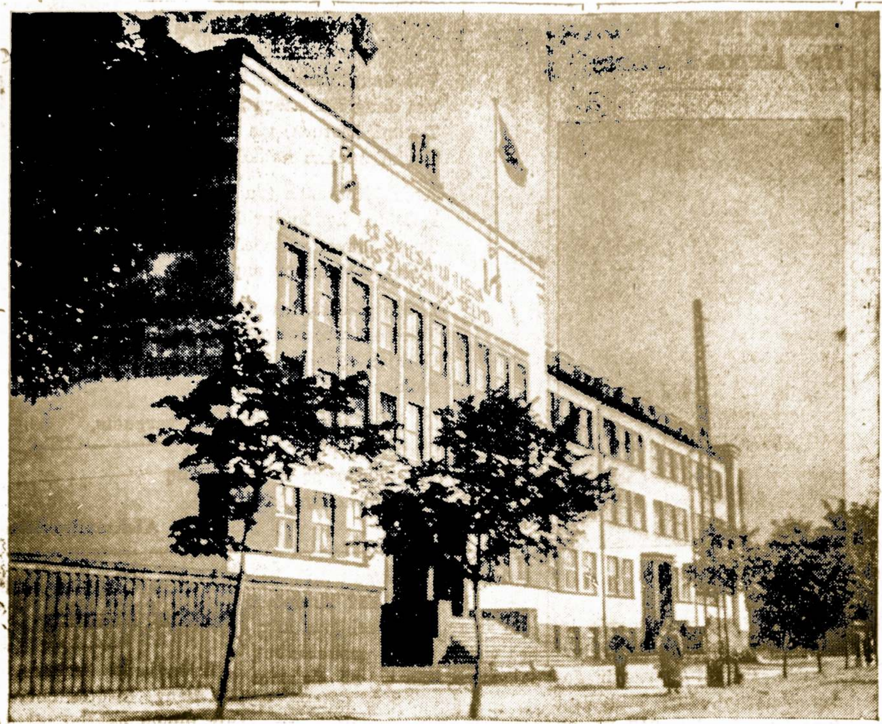
Ant Lietuvos valdžios įstaigų ir mokyklų vėl užplėvėsavo Trispalvė Vėliava. Čia mato me V. Kudirkos liaudies mokykla Šančiuose, kur vėl skambės lietuvių Dainos ir Himnas.

Mes žinome, kad dažnai žmogus duoda savo skilviui