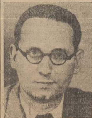
Pierre Pucheu, minister of Interior of France, who, with Perin-gault, chief of the Vichy cabinet, was found dead on a railroad track, apparently hurled from a train.