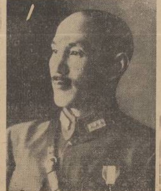
Generalissimo Chiang Kai-shek of

Atsistojęs priešaky 400 milijonų kiniečių, Czag Kaj Šek dažnai vadinamas Napoleonu iš Ningpo. Tai vardas mažos provincijos, kurioj jis gimė. Vaiku budamas jis dirbo krautuvėj, bet iš jos pabėgo ir įsirašė į mokyklą. 1905 metais jis išvyko į Japoniją mokintis karo dalykų. Paskiau įstojo į japonų armiją.