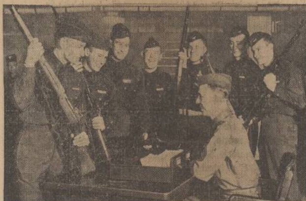
There's good reason for the smiles worn by these young men as they surrender their rifles to the seated sergeant. They have just changed status from cadets to commissioned officers at Randolph field, "West Point of the Air." They don't need the drill rifles any more, and are plenty happy about it.