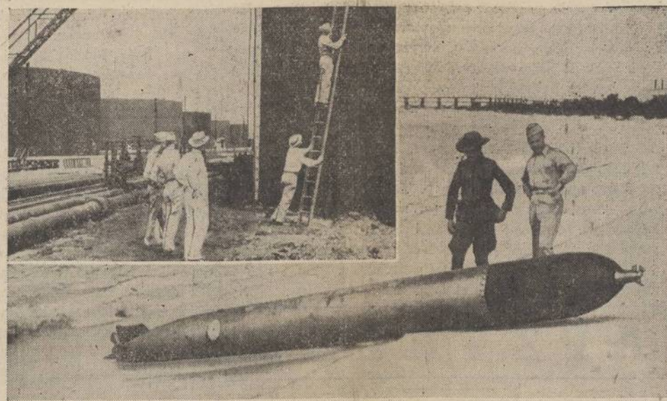
Above you see a torpedo fired by an Axis sub off the island of Aruba. It missed its target and ran aground. Later the 18-foot missile exploded, killing four Dutchmen who were attempting to dismantle it. Inset: Lieut. Col. William Ratten, of the U. S. Army, climbs a ladder to inspect a 4 by 6-inch dent in an oil tank on the island of Aruba following the torpedo and shelling attack of Axis subs.