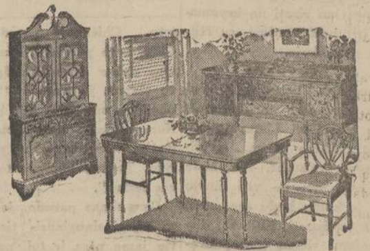
7 Dalių DINING ROOM Setas, vėliausios mados, gražiausio riešuto medžio $95.00

DIDELIS PASIRINKIMAS GERESNIŲ PEČIŲ IR SKALBIAMŲ MASINŲ. ROOSEVELT FURNITURE COMPANY 2310 W. Roosevelt Road