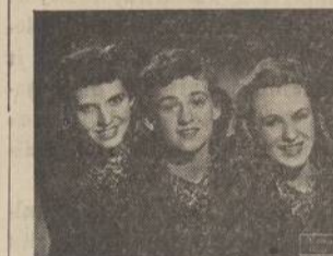
Liuliuojančios Lietuvaitės — Lietuvių Dainos Menininkės

Visi menate tuos skaisčiuosius vakarus, kai laukuose skambėdavo sutartinė. Kaip ji širdį viliojo ir jausmus gaivino! Tai jums dra gyviau primins balandžio 12 d., Ashland Blvd. Auditorijoje garsiosios "Liuliuojančios Lietuvaitės" —