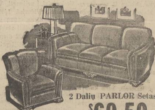
Mūsų pačių dirbtuvėje padarytas ir pilnai garantuotas