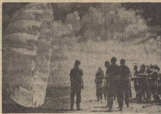
Aviation cadets at Goodfellow Field, San Angelo, Texas, grapple with a billowing parachute on a windy day. You'll appreciate the difficulty of their task if you have ever opened up an umbrella in a gale.