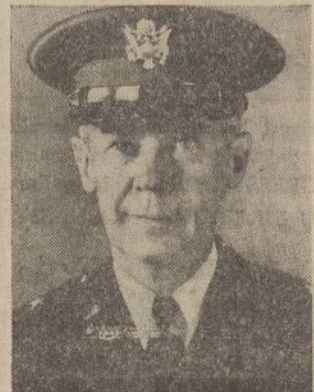
Maj. Gen. Charles Bonesteel of the U. S. army, who has assumed command of all American and British forces in Iceland. Most of the troops stationed in Iceland are American.

gužės 30 d., kapų iškilmėse galės pamatyti šį nepaprastai gražų paminklą, kuris tą dieną bus pašventintas.