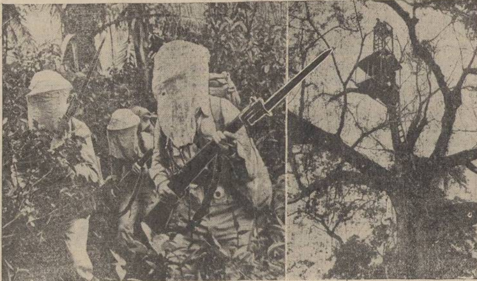
Apdengę Savo Galvas Nuo Daugybės Piktų Uodų, ši Grupė Suv. Valstijų Kariuomenės Maršuoja Miškų Tankumynais, Holandų Guianoje. Dešinėj Matome į Medį Įkeltą Observacijos Bokštą.