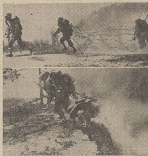
These future engineers are training at the engineers replacement center, at Fort Belvoir, Va. Upper photo shows them, after having cut out a barbed wire obstacle, advancing under a protective smoke screen. In the photo below they are leaving their trench and advancing under a protective smoke screen to a point of combat.