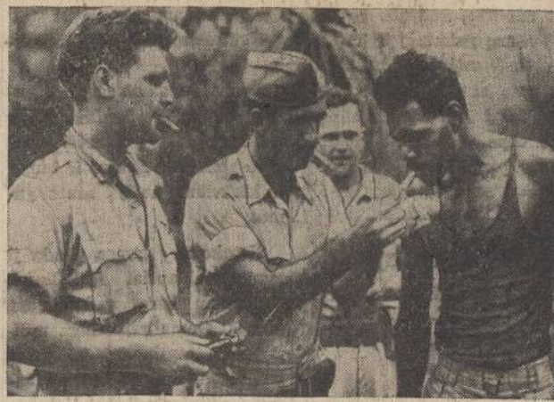
The Australians have long been in the habit of calling the aborigines "black fellows." American officers somewhere in the bush region of northern Australia are being palsied wally with a "black fellow" here.

of twenty-three pounds — from the horse.