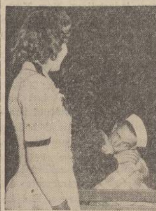
"Just one gal is enough for me," says an old song, but this sailor seems to be of a different turn of mind. While his arms are quite full, his wink speaks volumes.

Raudonojo Kryžiaus "Inquiry Service", per kurį žinios perduotos nuo asmenų Europoje ir kitose šalyse jų draugams Amerikoje, priėmė 16,000 įvairių komunikacijų per