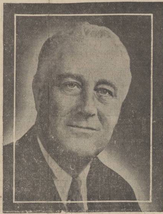
PREZIDENTAS F. D. ROOSEVELTAS

Joks žmogaus veikimas nežūna veltui. Nei vienas prakaito lašas, išlietas dėl idejos, nenėina veltui.