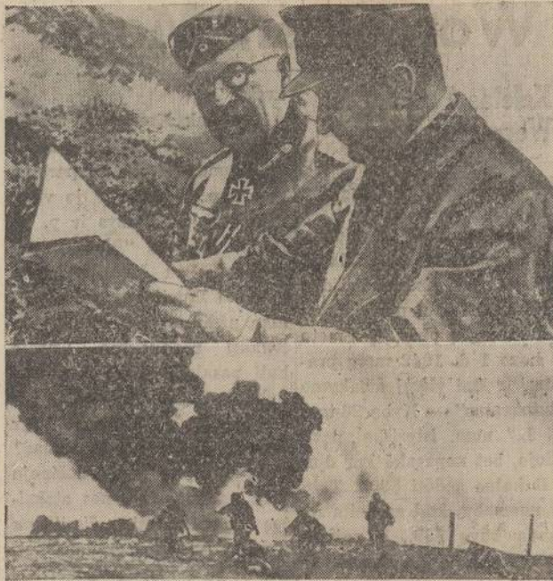
Sevastopol, gallantly defended Russian bastion, added another glorious chapter to its history before it fell to the invading Nazis. More than 100,000 Nazis fell here, according to the Russians. Photo at top shows Nazi General Von Manstein (left) discussing plans for an all-out invasion. Below: Nazi infantry shown in one of their charges against the key city.