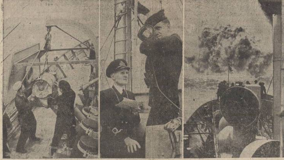
Canada's new mosquito boats are busy at their job keeping convoys safe from submarines in the St. Lawrence river. The sub-chasers, which are the Canadian navy's version of the U. S. "mosquito boat," are called "Fairmiles." They are 100 feet long, fast, and capable of carrying a record volume of depth bombs. In picture at the left two husky crewmen are given the ticklish job of loading a depth charge on a "Fairmile." Center: Typical, French-Canadian sailors enlisted in the Royal Canadian navy operate a blinker signal to escorting destroyers. Right: One hundred feet of water from the St. Lawrence cascades into the air as a depth bomb blasts the "sub" below.