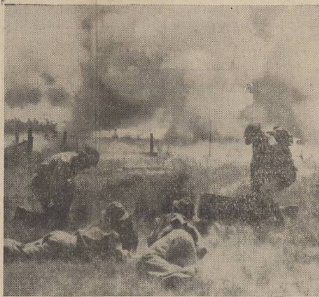
A barrage of 25 shells is fired from "Livens projectors" during the army's chemical warfare demonstration at Edgewood arsenal, Maryland. The projectors are used to throw destructive chemicals against the enemy, or smoke bombs to screen troop movements. Men in the foreground are telephone operators in contact with advance forces and the "plunger" man who sets off the charge.