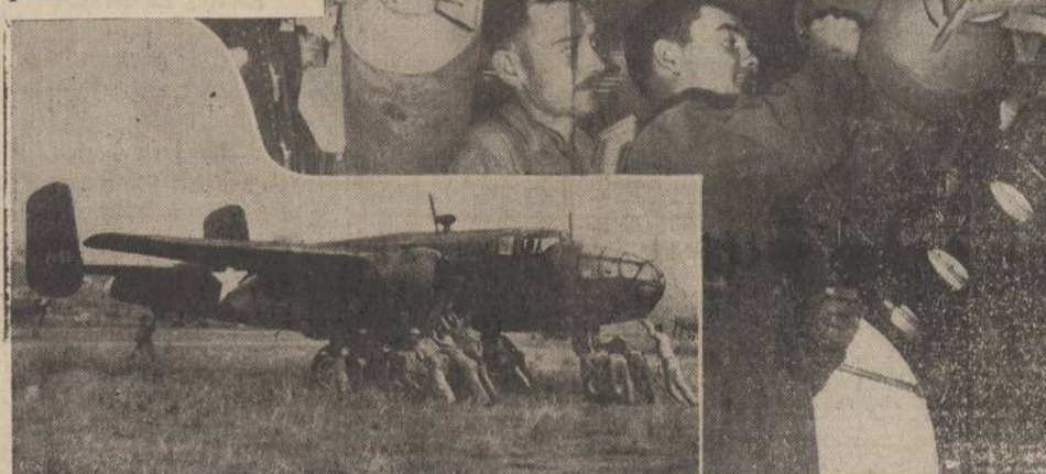
First photos to come out of the new air base in New Guinea from which U. S. and Allied fliers are striking at Jap bases: Right: Two fliers stand beneath the bomb bay of a U. S. bomber somewhere in New Guinea, inscribing 100-pounders. Left: American pilots and crew push a B-25 from the runway to make room for other planes to take off.