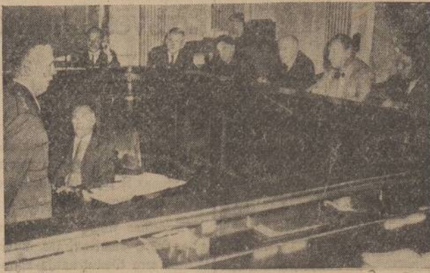
Photo shows the senate military affairs committee as it opened hearings on bill to authorize drafting of 18 and 19-year-old youths. General George Marshall was the first witness. He is shown addressing the committee. Left to right: Senators Bilbo, Schwartz, Downey, Thomas, Reynolds (chairman), and Gurney, who sponsored the bill in the house.