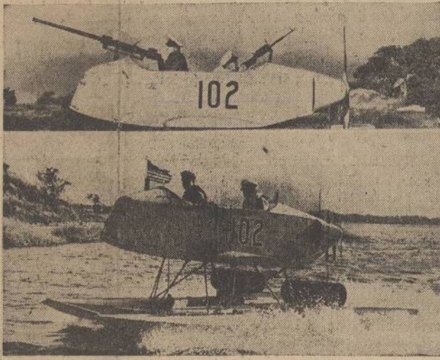
Newest weapon to combat the submarine menace is the sea-skimmer sub-chaser, which hops the waves at 50 miles per hour. It is armed with four depth charges, which can be replaced by torpedoes. Except for the engine and propeller, it is built entirely with non-strategic material—plywood plastic—and can be molded out by the thousands in a short time. As it is not driven by a water propeller it cannot be detected by submarines. Top photo shows the two-man crew at the guns. Bottom photo shows the sub-chaser skimming over the water.