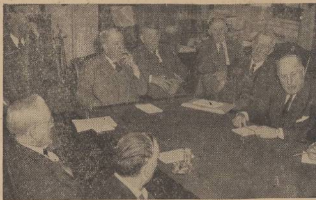
The new rubber director, William M. Jeffers, is shown as he appeared before the senate agriculture committee on a plan to substitute rayon for cotton in the manufacture of tires. Photo shows, left to right (bottom center), official reporter; Senators Norris, George, Smith (chairman), McKeller, Bulow, Aiken; and William Jeffers, witness.