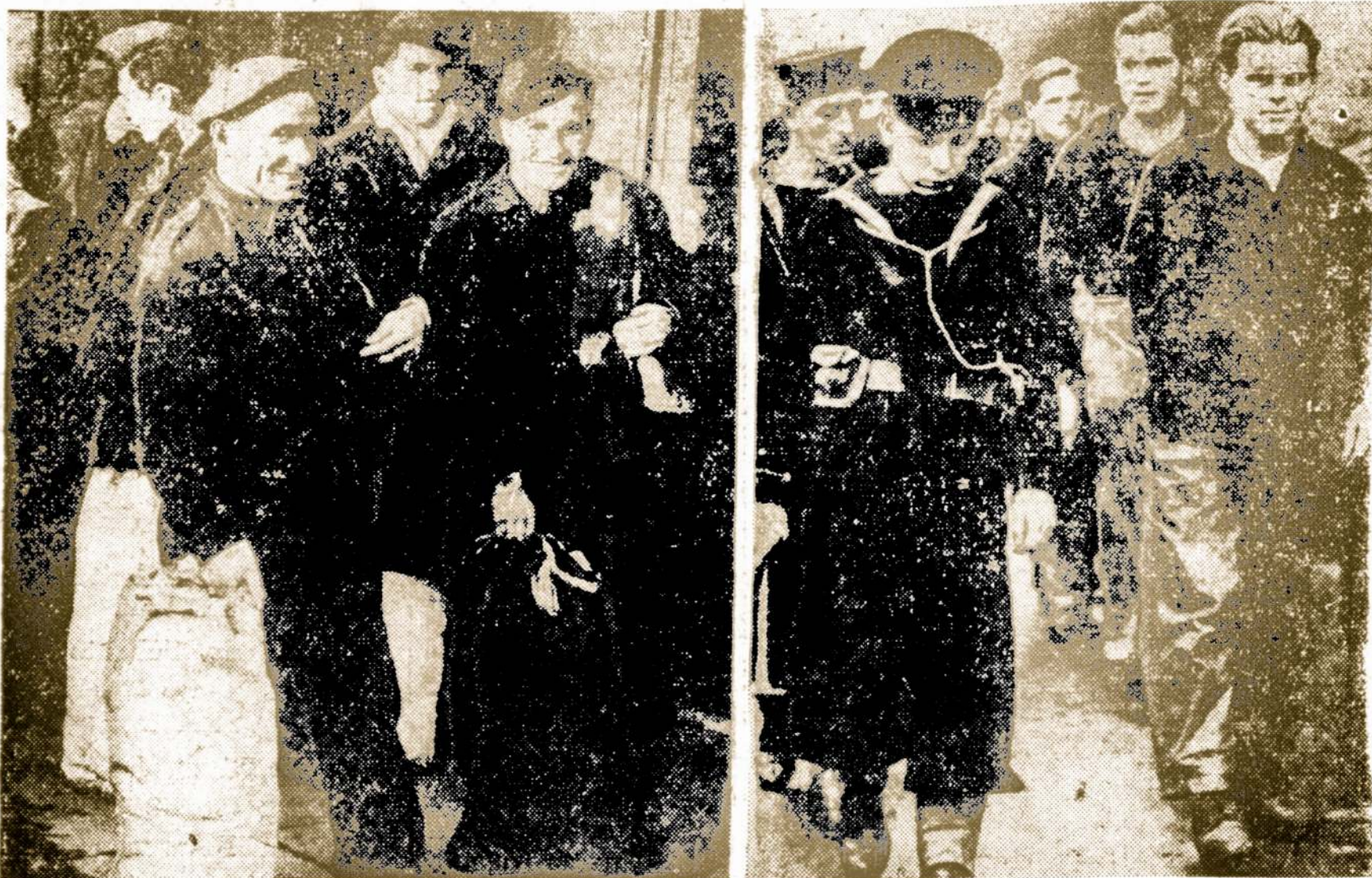
The brighter side for enemy soldiers is to be taken as war prisoners, as is apparent in this picture. Shown on the left are smiling Italian prisoners who realize that the war and all its horrors are over for them. They are on their way to a prison camp for the duration. On the right, German prisoners from a U-boat don't seem to be too unhappy over their plight. Perhaps they are thinking of food, shelter and comparative safety.