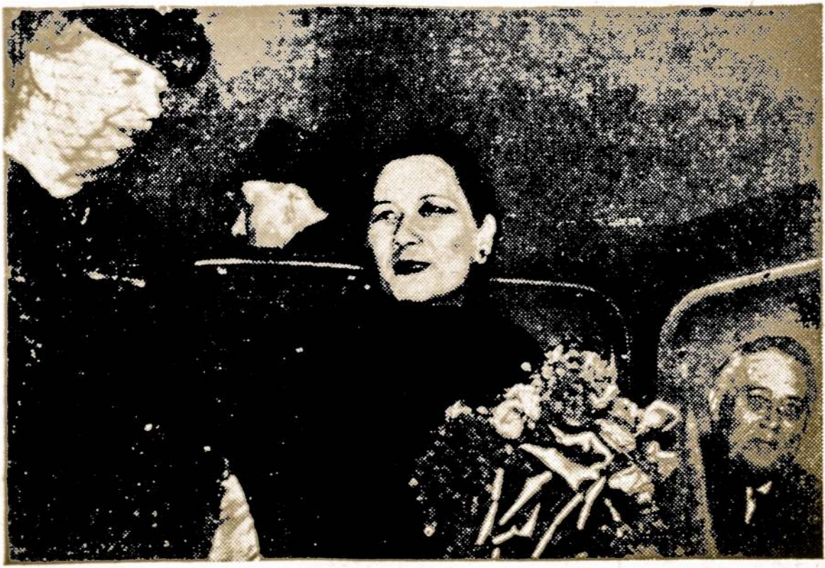
Madame Chiang Kai-shek, first lady of China, is shown on arrival in Washington to be a guest at the White House. President Roosevelt and his wife greeted the distinguished guest, who later addressed a crowded congress. Admission was by ticket.