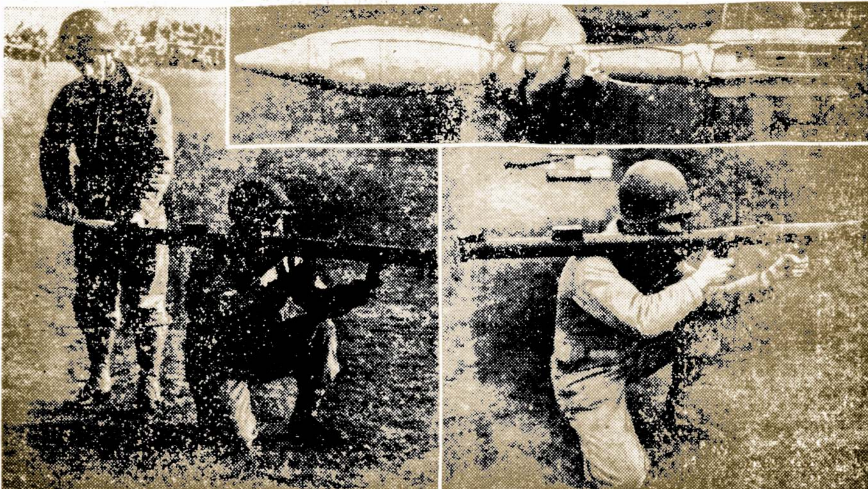
The similarity in the appearance of the army's new rocket gun to a popular freak wind instrument caused the gun to become known as the "Bazooka." Its official name is "Launcher Rocket, AT, M-1." It has enough hitting power to disable a tank, yet it can be used by one or two soldiers in places which are inaccessible to regular, large, anti-tank guns. Left: Loading a rocket into the rear of the Bazooka. Top right: This is the anti-tank rocket shell which is fired by the Bazooka. Bottom right: The proper way to hold the Bazooka. The new weapon is more than 50 inches long and approximately three inches in diameter. It is open at both ends.