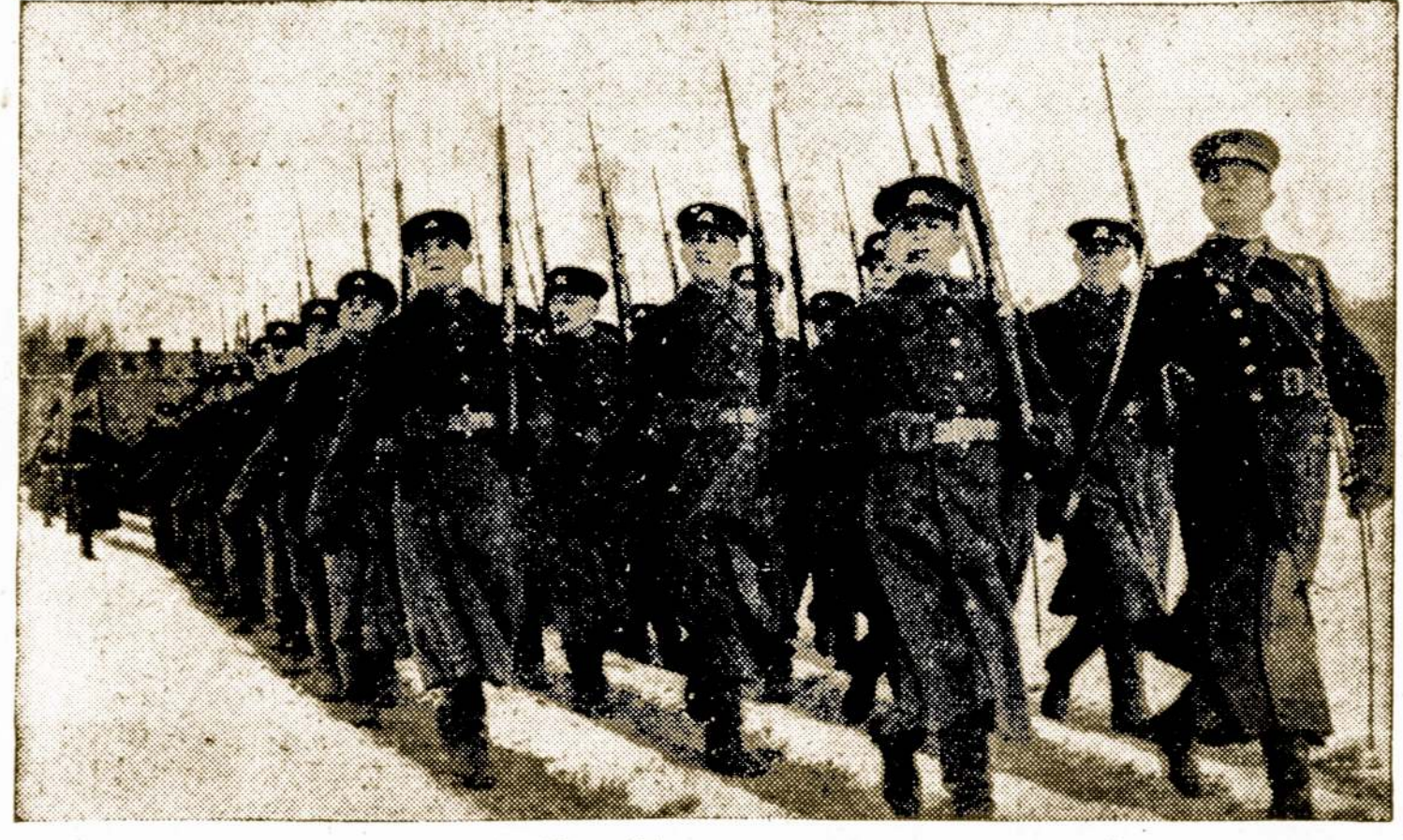
Kovotojai už Lietuvos Laisvę Nepriklausomos Lietuvos Metu, Šiandiena Kovoja Sustelkę į "Požemines" Organizacijas Prieš Nazius Okupantus.

Tačiau tankiai iš didelio debeso būna mažai lietaus. Ward kompanija patriukšmaus ir turės nusileisti. Nors ji ir turėtų savo pusėje daug tiesos, bet reikia atsiminti, kad dabar karo metas ir tenka pakelti nekuriuos net ir skaudžius suvaržymus.