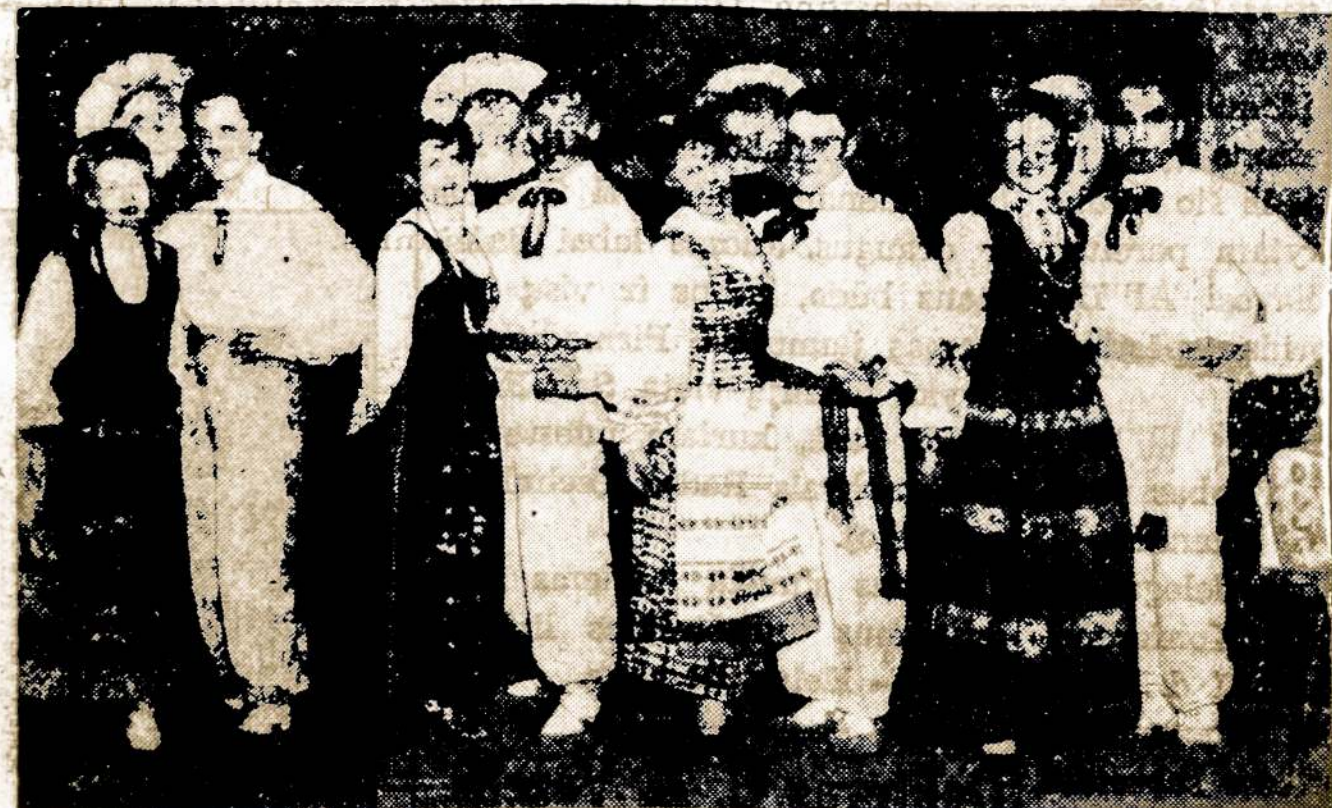
PASIZYMEJUSI ATEITININKŲ DRAUGOVĖS ŠOKĖJŲ GRUPĖ

Todel prisidėkite, nusipirkite nors vieną extra karo boną dabar kada yra $5,000,000 vajus. Ateikite į "Victory House" balandžio 27-28-29 dienomis ir nusipirkite karo boną, arba, kurie