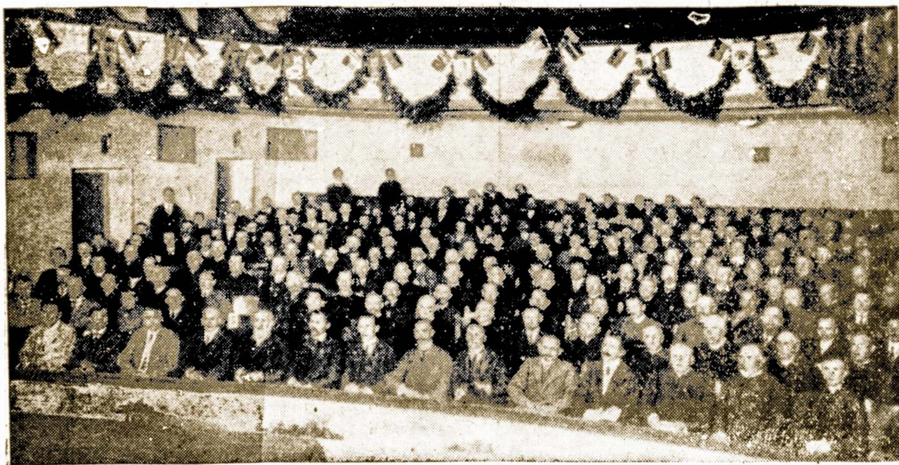
Didžioji Lietuvių Konferencija Vilniuje 1917 metais, Kurioje Buvo Padėti Pamatai Nepriklausomai Lietuvai.

Prie to visko pridėk gerus ūkius ir gražiai išbudavotą miestą, tai nebus sunku suprasti del ko Vilnius taip stipriai traukia ir lenkų akį. Tai vis, mat, Lietuvos sukrautas turtas, del kurio varšuviečiams ir krakuviečiams nerikėjo išlieti nei lašelio prakaito. Tą viską jie gautų už dyką. Ne del ko kito maskoliai skverbiasi ir į visą Lietuvą, kur maisto ir drabužių niekad netrūkio. Komunistams svetima nuosavybė irgi gardžiai kviepia.