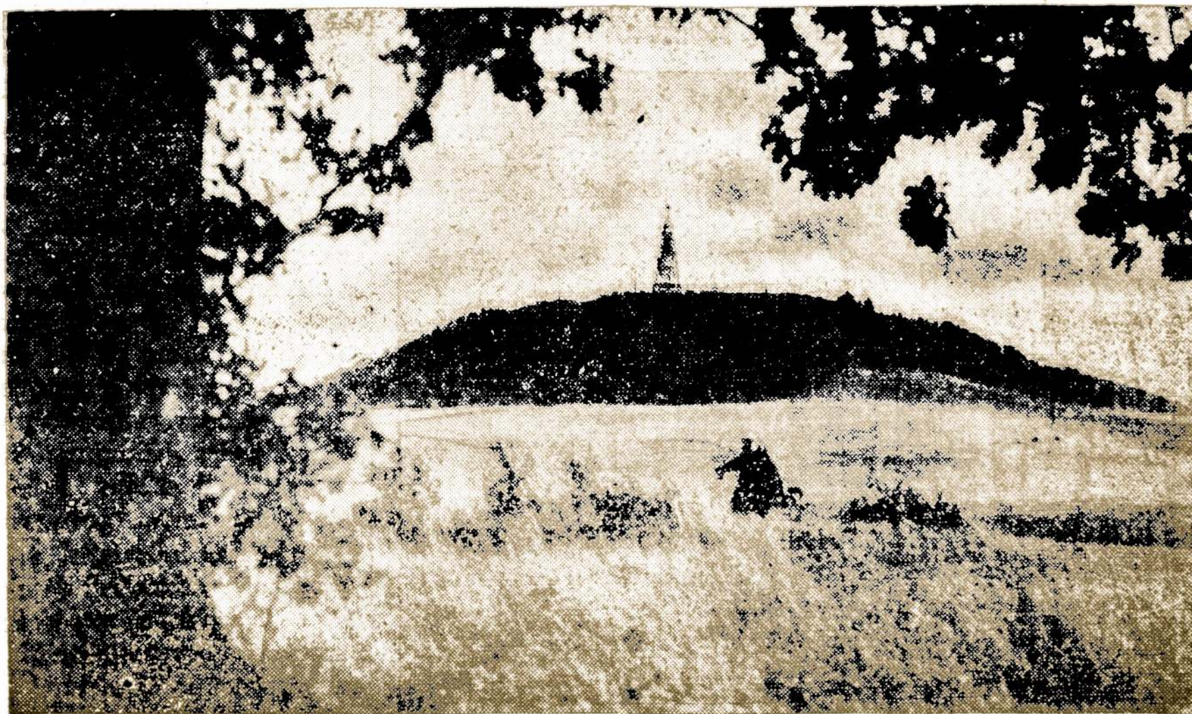
Vienas Piliakalnių Lietuvoje, Kuris Laikomas Žmonių Pagarboj.

Kaip žinome, pereinamame mėsnyje tapo įvesta kainų aukštumas seniems ir vartotiems automobiliams. Tas apsaugos pirkėjus nuo perdidelio nulupimo. Dabar perleidžiant automobilio "title" abi pusės turi pasirašyti kontraktą, kuris įteikiamas War Price and Rationing Board, reikalaujant knygtės su gazolino kuponais. Užmokėta kaina už automobilį pažymėta tame kontrakte.