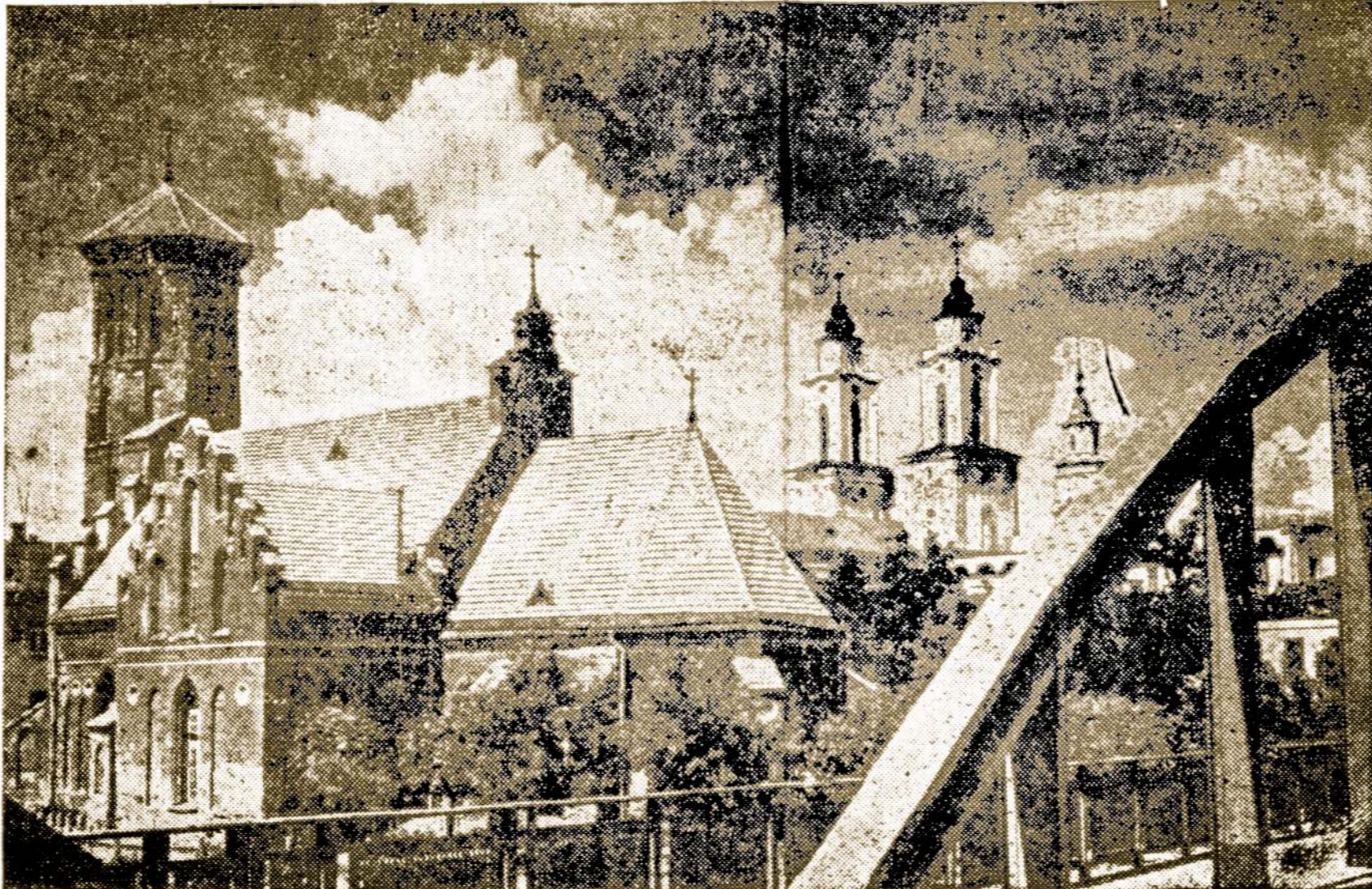
Kauno Miesto Mūrai Pro Kurios Nesenai Praėjo Didieji Mūšiai. Kaunječiai Tačiau Dar Ir Dabar Girdi Kanuolių Baubimą.

Jeigu toje konferencijoje būtų atlikti panašūs dalykai, tai ji ne tik nieko neužtemdintų, bet visus nustebintų ir sukeltų ant kojų. Toks padalinimas reikštų likvidavimą Baltijos kraštų ir pradžia naujo imperializmo Europoje.