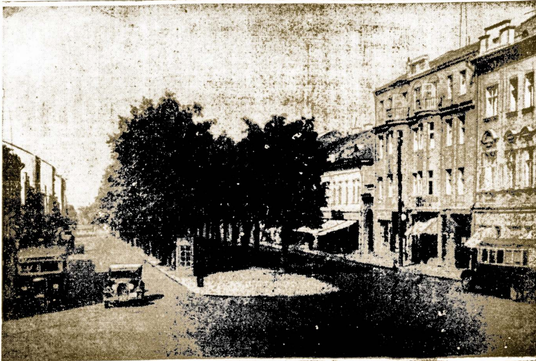
Laisvės Alejos Kaune Vaizdas, Prieš Dabartinį Karą. Bestraukdami Vokiečiai Išsprogdino Daugelį Namų.

Anglų Bažnyčios organas "The Church Time" idėjo ilgą straipsnį apie bolševikų elgesį Baltijos kraštuose ir Lenkijoje. Pasirodo, jog sovietai skaito savo teritorija tuos plotus, į kuriuos įkelia savo koja. Jie saugaliauja ne tik rytus nuo Corzono linijos, bet ir vakarus. Pav. Tarnopolyje. Rytų Galicijoje, sovietų valdžia suėmė visus vyrus nuo 17 metų iki 50 ir kur tai išvežė. Vilniuje ir jo apylinkėse suimta 2,500 vyrų, kovojusių prieš vokiečius. Jie tapo uždaryti koncentracijos stovyklose. Mobilizavimas ir raudona armija arba "tarybinės" Lietuvos armiją tęsiasi.