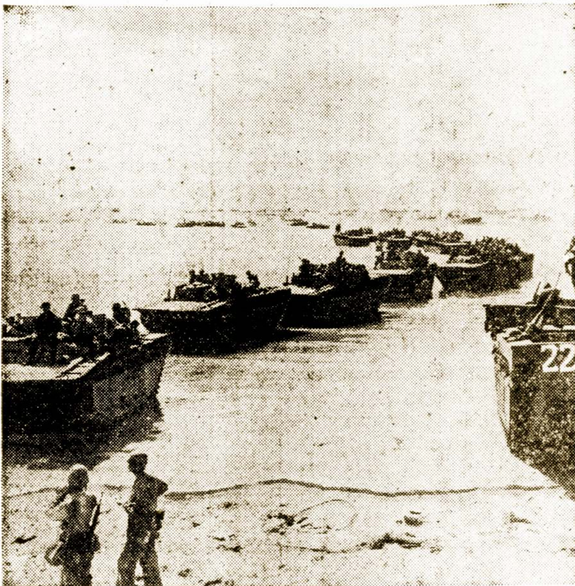
A long line of marine and army amphibious tractors, coming into the beach at Tinian island, looks like a holiday excursion train, one after another as they near the shore. It was just another stop on the road to Tokyo and when the island fell it proved the GIs and Leathernecks were more than a match for the best that Tokyo could give.