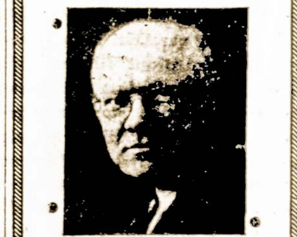
W. J. STANKUNAS FOTOGRAFAS

Fotografavimo Studija Visų Rušių Nuotraukos