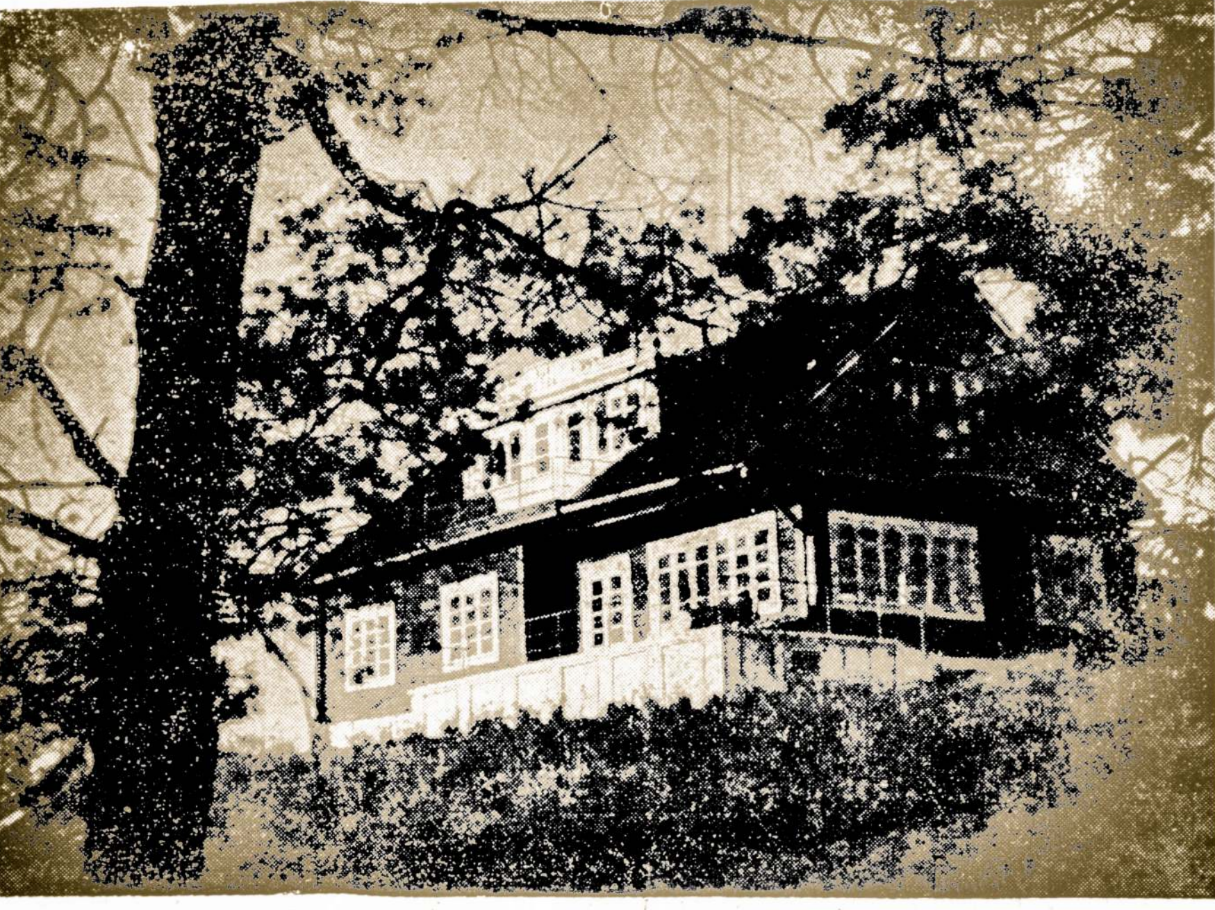
Vienas Gražių Vasarnamių Palangoje, Kurį, Beabejo, Sunaikino Žiauriojo Karo Ugnis.

Taigi pasekoje šio karo, Europoje gali įsivyruoti Lenino principas: griebk kas tik papuolė rankas, nes tai vis vien "buržuaziškas" turtas. Jeigu taip ištikro atsitiks, tai senutė Europa pergyvens vieną juodžiausių laikotarpių savoje istorijoje.