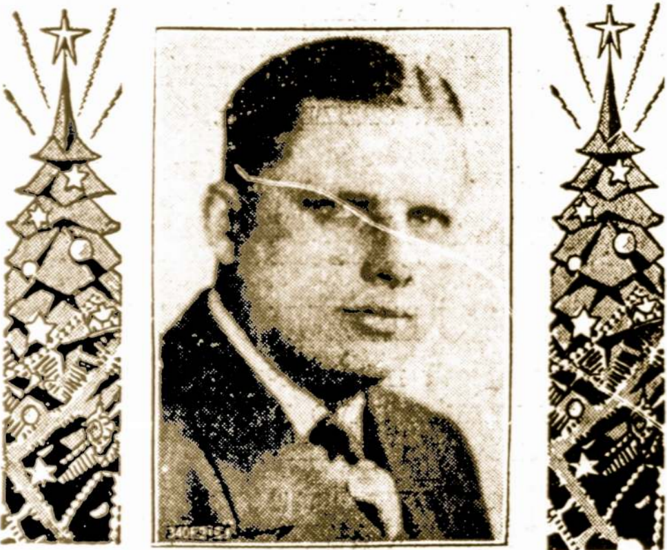
AL. G. KUMSKIS PIRMININKAS

Linkime Visiems Savo Draugams ir Kostumeriams.