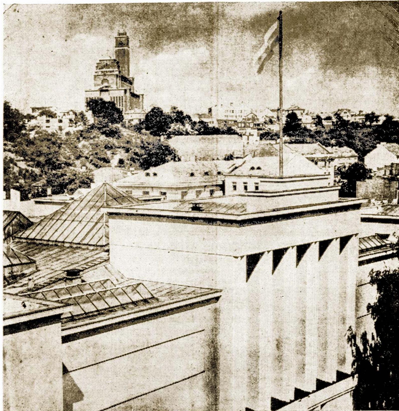
KAUNO MIESTO REGINYS IŠ KARO MUZIEJAUS BOKŠTO. KALNE MATOSI PRISIKELIMO BAŽNYCIA, KURI VADINAMA TAUTOS PANTEONAS. AR JI TEBERĀ? AR VYTAUTO MUZIEJUS NEISSPROGDIINTAS? KOL KAS TUREJOME ŽINIŲ, KAD NACIAI ATŠITRAUKDAMI TUOS PASTATUS SUNAIKINO.

Taigi mažosios tautos gali bepasitikėti tikta Amerika, ku- ri savo principų dar nėra išsi- žadėjusi. San Francisco konfe- rencijoj ir vėlesnėse konferen- cijose ši šalis galės sulosti iš- ganytojo rolę ir apsaugoti se- nutę Europą nuo naujų vilkų suėdimo. Bet Amerika turi pra- bilai drąsiau ir atviriau. Karas jau artinasi prie pabaigos. Iki šiam laikui lemiantį žodi tar- davo generolai; nuo dabar svar- styklės nusvirs į diplomatų pu- sę. Pastovios, teisingos taikos klausimai atsidsurs pirmose svar- stymų programose. Todel Ame- rika turi prabilta, kaip žmonių laisvės čempionas.